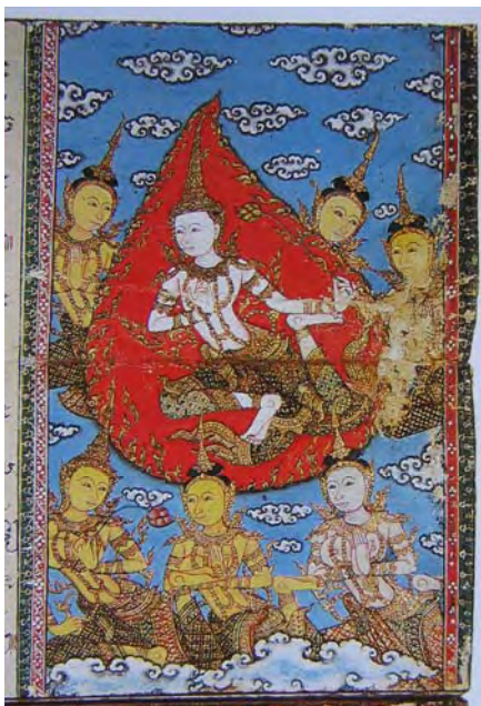
ภาพที่ 4 ภาพจิตรกรรมไทยจากสมุดข่อย

ที่มา : John Malyon/Artcyclopedia, Okita of the Naniwaya Teahouse [Online], accessed 20 March 2006. Available from http://www.artcyclopedia.com/artists/detail/Detail_utamaro_kitagawa.html