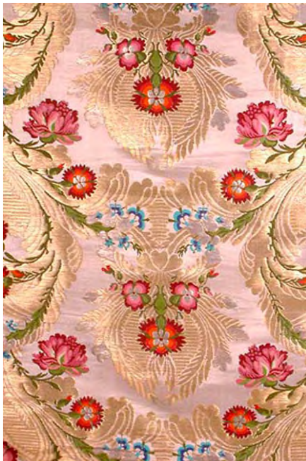
ภาพที่ 8 ผ้าไหมลายของธิปต