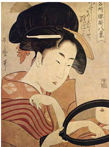
ภาพที่ 3 ภาพเหมือนของโอกิตะโดย Utamaro ค.ศ. 1790