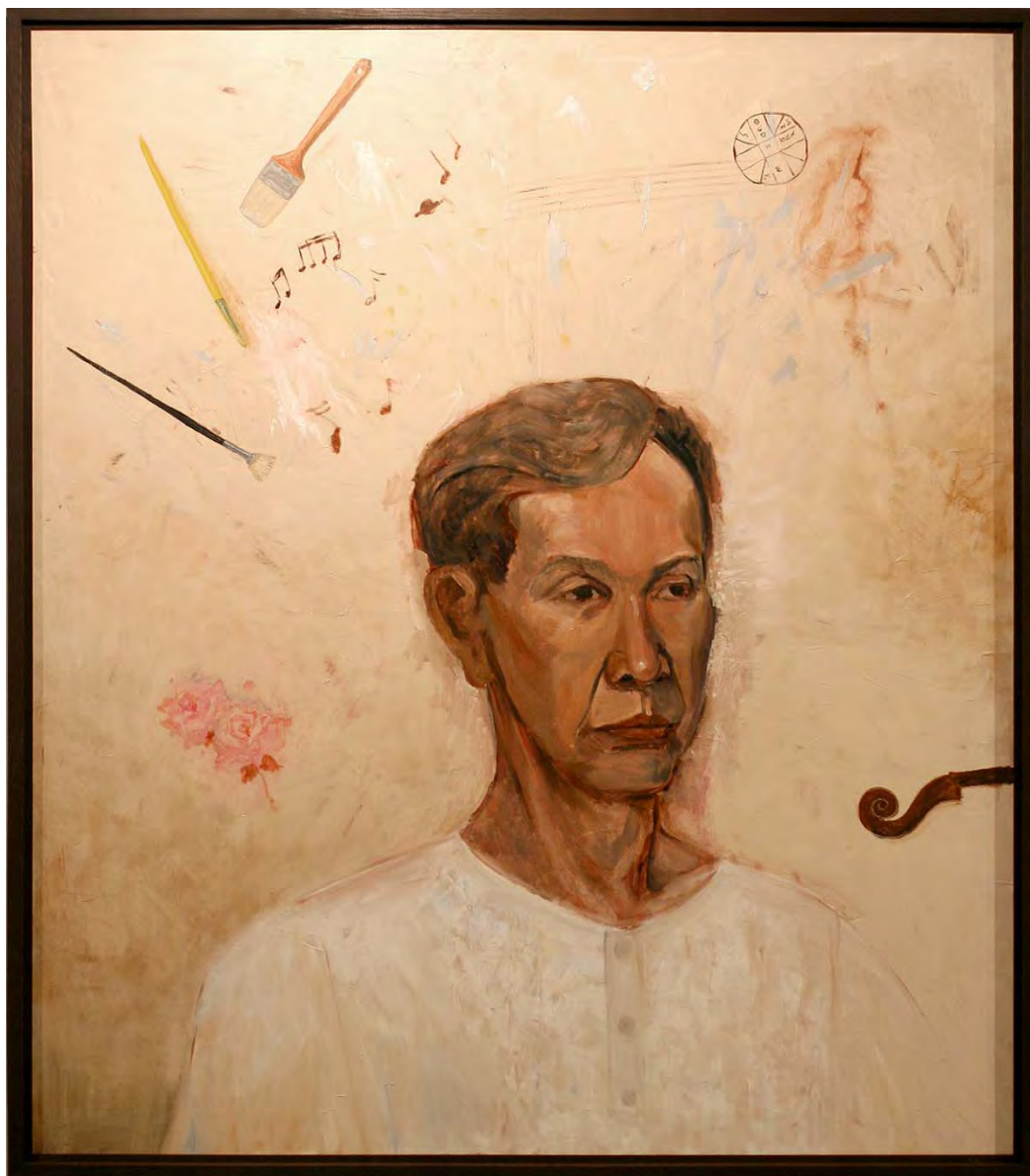
ภาพที่ 12 ภาพผลงานวิทยานิพนธ์ชิ้นที่ 1