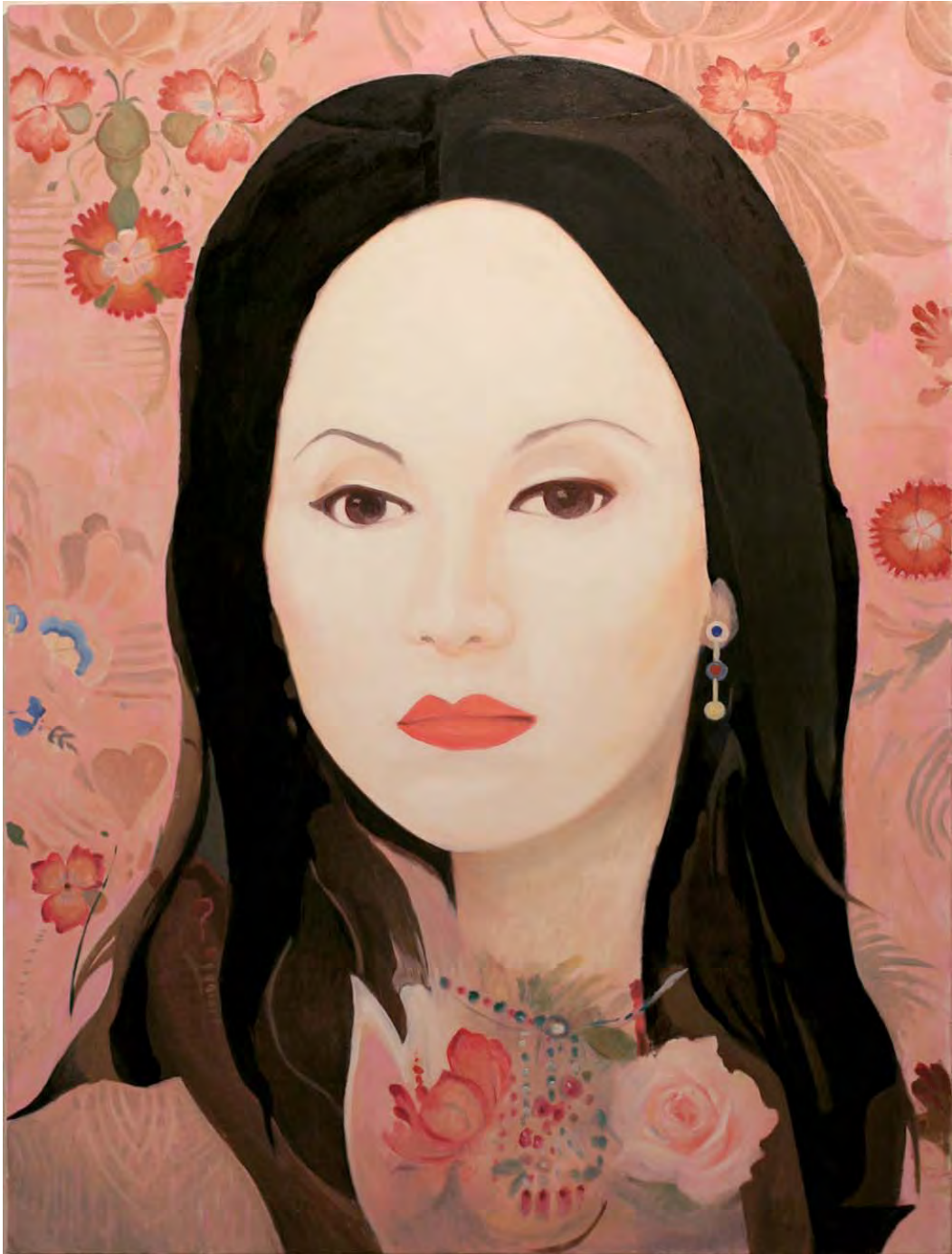
ภาพที่ 19 ภาพผลงานวิทยานิพนธ์ชิ้นที่ 8