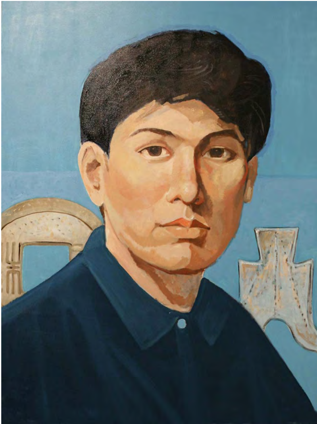
ภาพที่ 16 ภาพผลงานวิทยานิพนธ์ชิ้นที่ 5