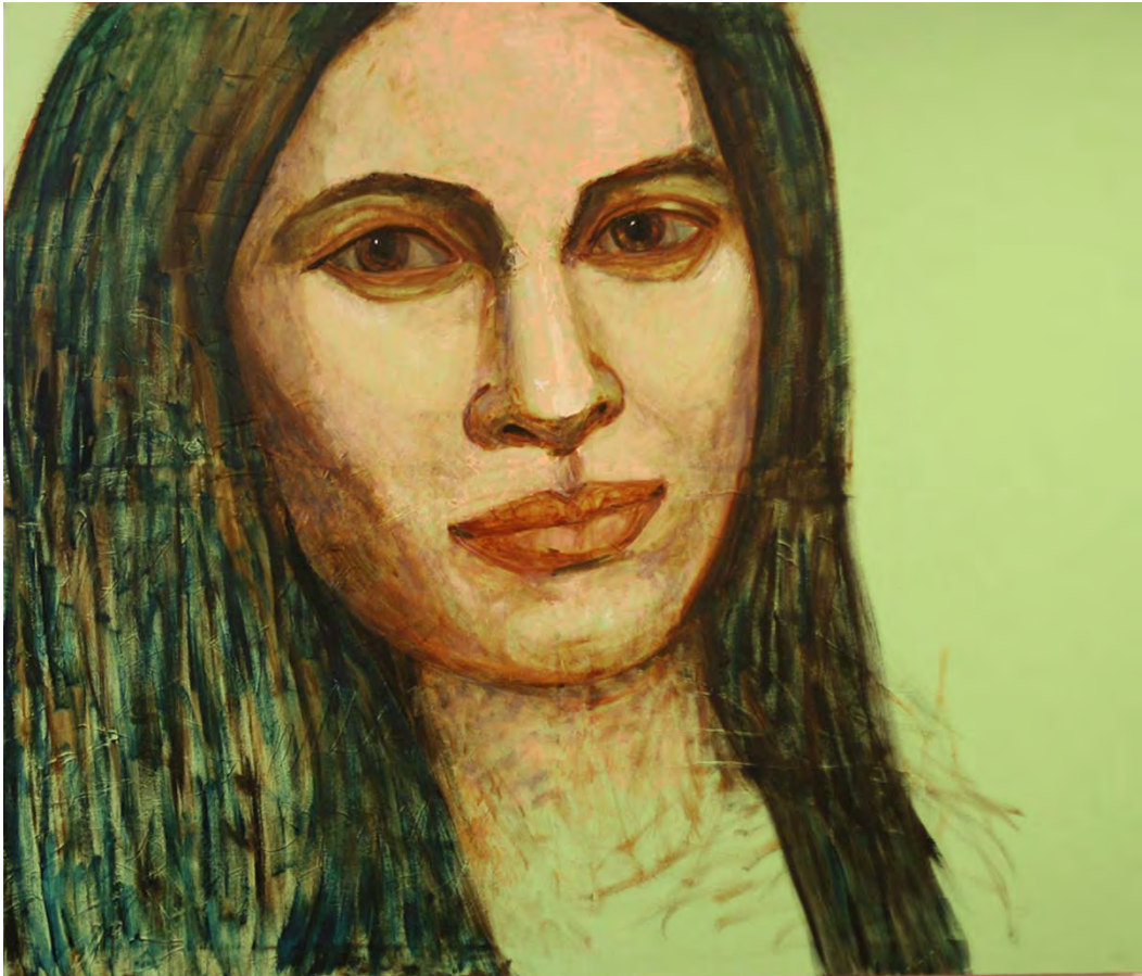
ภาพที่ 14 ภาพผลงานวิทยานิพนธ์ชิ้นที่ 3 ชื่อภาพ แม่ (My Love) ขนาด 150 x 130 ซม. เทคนิค สีน้ำมันบนผ้าใบ