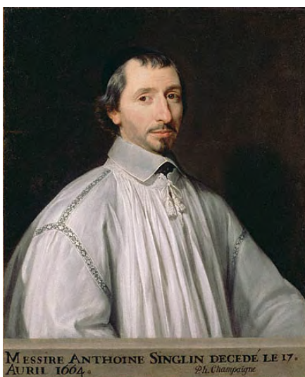
ภาพที่ 2 ภาพเหมือนของ Antoine Singlin โดย Champaigne ค.ศ. 1664