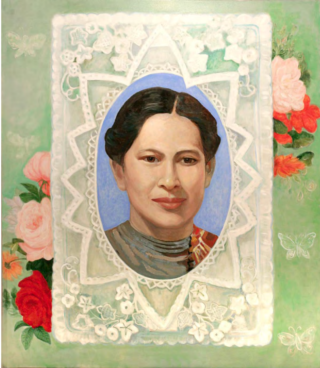
ภาพที่ 13 ภาพผลงานวิทยานิพนธ์ชิ้นที่ 2