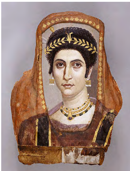
ภาพที่ 1 ภาพเหมือนบนผ้าโลงมัมมี่ของอียิปต์ สมัยโรมัน ค.ศ. 100 - 110

ที่มา : J.Paul Getty Trust, Mummy Portrait of a Woman [Online], accessed 25 January 2006. Available from http://www.getty.edu/art/gettyguide/artObjectDetails?artobj.=11098