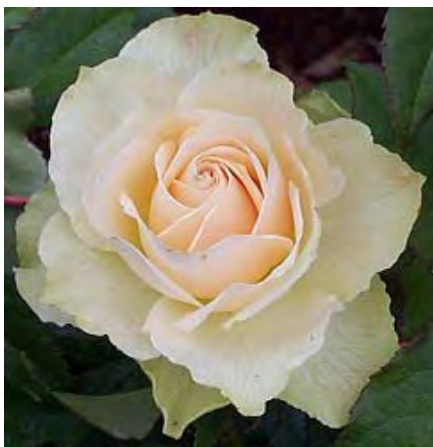
ภาพที่ 9 ภาพดอกกุหลาบ