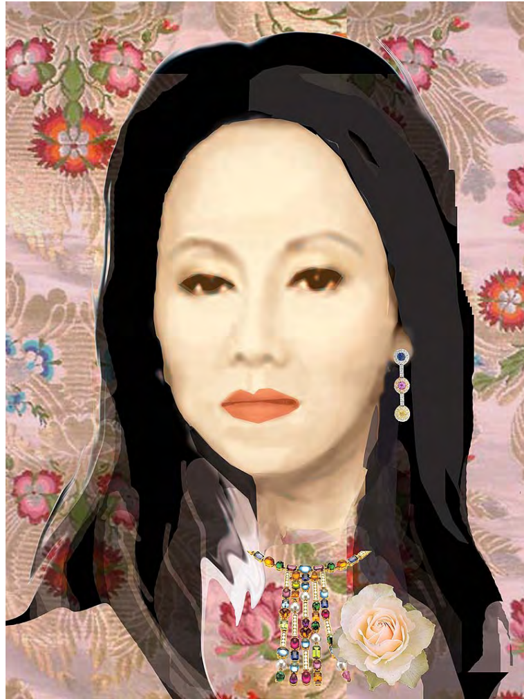
ภาพที่ 11 ภาพร่างงานวิทยานิพนธ์ โดยใช้โปรแกรมโฟโต้ช้อป (Photoshop) ที่มา : จากการลงมือทำของผู้วิจัย