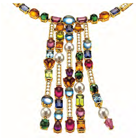
ภาพที่ 10 สร้อยคอ ที่มา : Bulgari Spa, 2005411152822 [Online], accessed 25 January 2006. Available from http://www.bulgari.com/bulgari01.asp