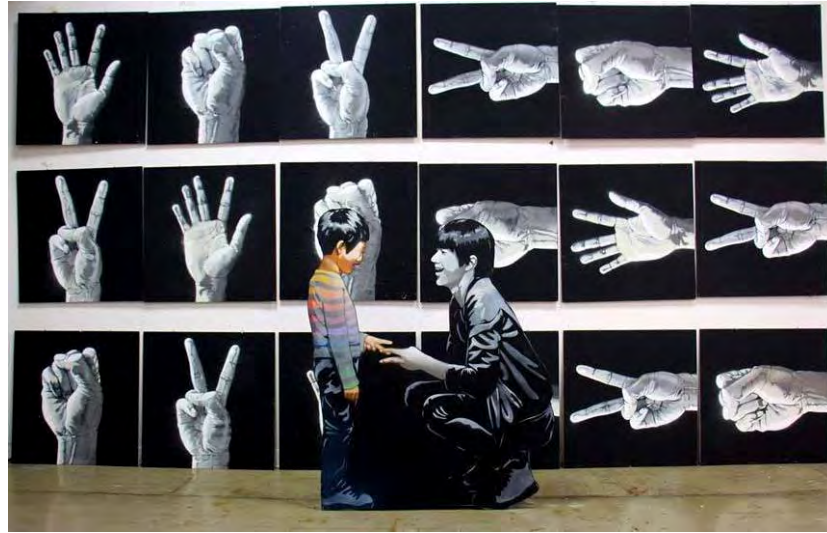
ภาพที่12 "ยัง ยิง เยาร์" เทคนิคแม่พิมพ์ลายฉลุบนไม้ (Stencil on Wood) พ.ศ. 2558

ผลงาน "ยัง ยิง เยาร์" เป็นการพัฒนาผลงานต่อจากผลงานชิ้นก่อนข้าพเจ้าได้ใช้สัญลักษณ์ในการ การเล่นในวัยเด็กมาใช้คือการเป่ายางซูปที่ใช้เพียงแค่มือในการเล่นด้วยการแทนเป็นความหมาย ต่าง ๆ เช่น กลางมือออกแทนกระดาด กำมือคือค้อน ใช้สองนิ้วคือกรรไกร เป็นการเล่นทายใจของ ผู้เล่นของฝ่ายตรงกันข้ามเพื่อหาคนที่จะชนะ ข้าพเจ้าจึงเกิดความคิดในการสร้างสรรค์จากการเล่น ชนิดนี้ ข้าพเจ้ามองว่าเกมส์นี้เป็นการหาทางออกในการตัดสินใจโดยไม่ต้องใช้ความคิดใด ๆ มาหาเหตุผล ใช้เพียงการทายใจของผู้เล่นฝ่ายตรงกันข้าม และข้าพเจ้าจินตนาการต่อยอดจากการใช้สัญลักษณ์นี้ ด้วยการเปลี่ยนมุมมอง จากการกลางมือออกเป็นการชูมือแทนการตั้งคำถามหรือเป็นการทายใจในการ จะพูดด้วยการขออนุญาตด้วยการยกมือ การกำมือคือการต่อสู้ ความแข็งแรงและความยุติธรรม การ ใช้สองนิ้วคือสัญลักษณ์แห่งชัยชนะ เป็นต้น