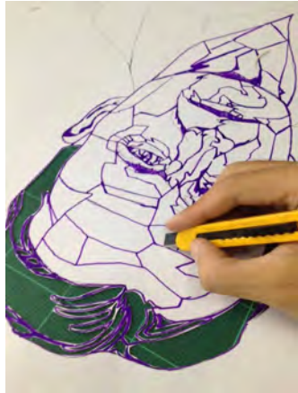
ภาพที่5 การตัดฉลุลายแม่พิมพ์

5.สร้างผลงานด้วยเทคนิคภาพพิมพ์ลายฉลุเตรียมวัสดุแผ่นกระดาษอัดที่ใช้รองรับที่พ่นสีสเปรย์ลงไปแล้วนำแม่พิมพ์ที่ตัดเสร็จเรียบร้อยแล้วมาพ่นตามสีที่กำหนดจนครบทุกแม่พิมพ์จากนั้นทำการใช้เครื่องมือเลื่อยตัดตามเส้นรอบนอกของภาพบุคคลนำส่วนที่ไม่ต้องการออก