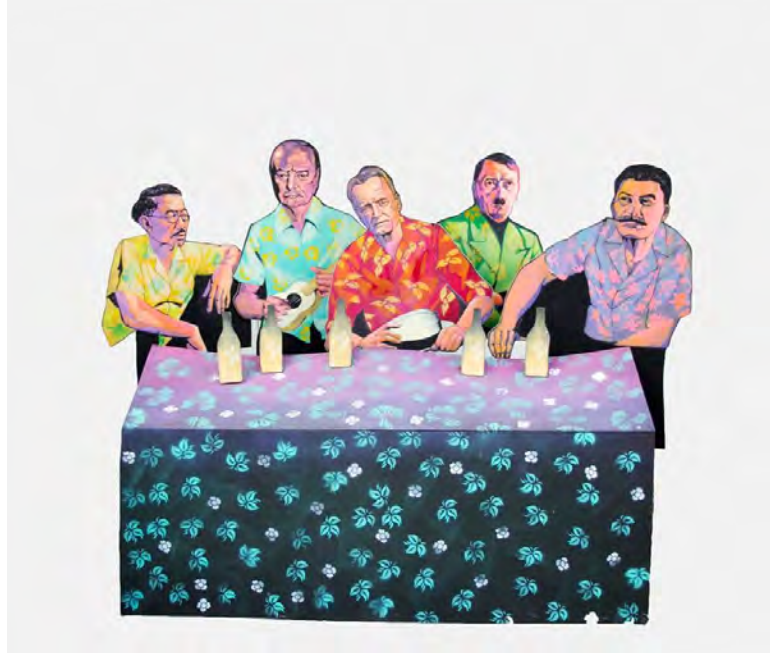
ภาพที่13 "วันพักผ่อนจากเรื่องร้าย ๆ "

เทคนิคแม่พิมพ์ลายฉลุบนไม้ (Stencil on Wood)2559