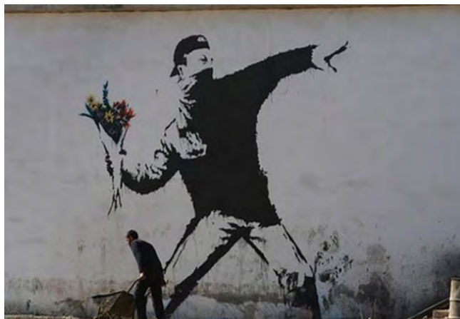
ภาพที่ 2 แบงก์ซี, Flower Thrower (ค.ศ. 2003) เทคนิคสแตมป์สีบนกำแพง

ผลงานชิ้นนี้ได้แสดงออกในทางย้อนแย้งจากรูปคนที่กำลังปาสิ่งของออกไปมีกริยาหรือท่าทางที่ดูรุนแรงแต่สิ่งของที่กำลังจะขว้างออกไปนั้นเป็นดอกไม้เป็นการใช้สัญลักษณ์เพื่อเรียกร้องถึงสันติภาพเป็นการเรียกร้องให้ผู้คนในสังคมตระหนักถึงปัญหาของสงคราม ความรุนแรงที่เกิดขึ้นการแสดงออกเป็นการหยิบภาพลักษณ์ของเหตุการณ์ความรุนแรงมาใช้เป็นสัญลักษณ์