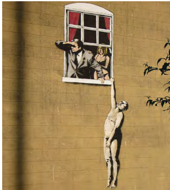
ภาพที่1แบงก์ซี่ ,Naked Man (ค.ศ.2006) เทคนิคสแตมป์ซิลบนกำแพง