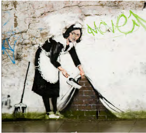
ภาพที่3 แบงก์ซี ,Sweep Under The Carpet (ค.ศ.2006) เทคนิคสแตมป์ซิลบรอนกำแพง

ผลงานชิ้นนี้มีการเจาะจงกับพื้นที่ด้วยการใช้พื้นที่ ๆ มีอยู่จริงสนับสนุนผลงาน และมีเนื้อหาเชิงเสียดสีคนชั้นสูงเพราะสมัยนั้นบุคคลที่จะถูกวาดนั้นมักจะมีแต่คนชั้นสูง แบงก์ซีต้องการแสดงออกให้เห็นถึงความเท่าเทียมกันในสังคมไม่ว่าจะจนจะรวยทุกคนนั้นมีสิทธิเสรีภาพที่เท่ากัน และต้องการให้คนได้รับรู้ถึงปัญหานี้ไม่ว่าจะปกปิดอย่างไรทุกคนก็รับรู้