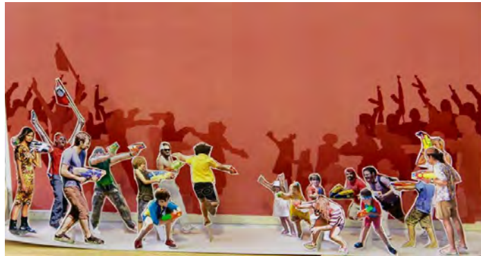
ภาพที่4 ภาพต้นแบบจำลองผลงาน

2. สร้างแบบร่างด้วยวิธีการร่างภาพบนกระดาษและผ่านกระบวนการตัดต่อในคอมพิวเตอร์ เพื่อสร้างรูปแบบให้มีความเหมาะสมในการนำเสนอเพื่อนำมาสร้างเป็นต้นแบบจำลองผลงานเพื่อให้ เห็นถึงภาพรวมของแบบร่างของผลงานที่มีความชัดเจน