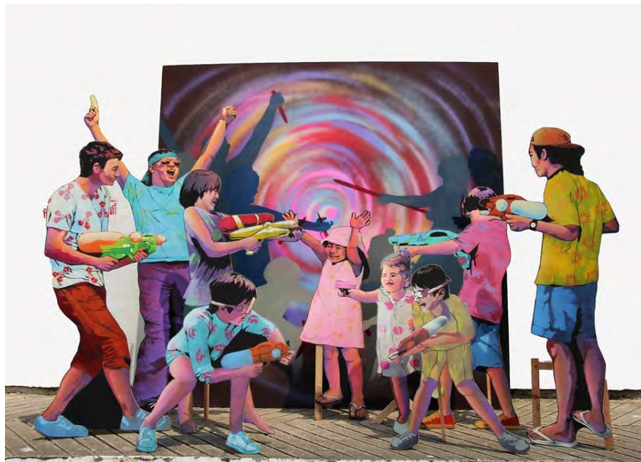
ภาพที่14 "ปีน ... น้ำ" เทคนิคแม่พิมพ์หลายฉลุนไม้ (Stencil on Wood) 2559

ผลงาน "ปีน ... น้ำ" เป็นการสร้างสรรค์ที่ได้แรงบันดาลใจมาจากเทศกาลการเล่นน้ำในวันสงกรานต์ในยุคปัจจุบัน บวกกับเหตุการณ์ความรุนแรงที่เกิดขึ้นระหว่างที่มีเทศกาลเข้าพเจ้าจึงต้องการนำเสนอถึงแง่มุมนี้ และต้องการให้ผู้คนให้ความสำคัญกับสิ่งที่เกิดขึ้น และตั้งคำถามว่าทำไมเหตุการณ์แบบนี้ยังคงเกิดขึ้นทุก ๆ ปีราวกับว่าเป็นเรื่องปกติผลงานชิ้นนี้ต้องการนำเสนอถึงประเด็นที่ว่าวันสงกรานต์ที่ใช้ปืนฉีดน้ำเล่นกันหรือว่าเป็นวันทำสงครามของเหล่าวัยรุ่นที่พกมีดพกปืนมาเล่นกันชื่อผลงานถูกเว้นไว้เพื่อให้ผู้ที่ดูผลงานได้ตัดสินใจเองว่าช่องว่างนั้นควรเติมคำไหนลงไปแล้วแต่คนดูจะตัดสินใจ ผลงานจะใช้รูปทรงของคนสองกลุ่มแบ่งฝั่งซ้าย และขวาที่ถือปืนฉีดน้ำกำลังเล่นสงกรานต์กัน เมื่อมอง