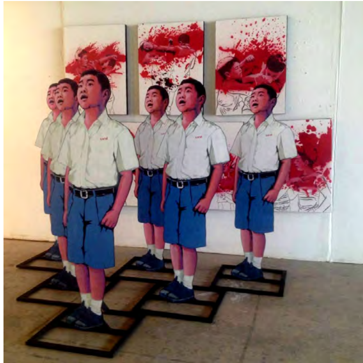
ภาพที่15 "จงทำดี จงทำดี จงทำดี" แม่พิมพ์หลายฉลubenไม้ (Stencil on Wood) 2560

ผลงาน "จงทำดี จงทำดี จงทำดี" เป็นงานศิลปะนิพนธ์ชุดสุดท้ายที่ได้แรงบันดาลใจมาจากการเรียนลูกเสือสำรองจงทำดีเป็นคำกล่าวเพื่อเป็นสติ และข้อคิดเตือนใจในการใช้ชีวิต และการศึกษาเล่าเรียนตั้งแต่เด็ก ๆ นั้นทุกคนจะถูกปลูกฝังมาว่าให้เป็นผู้ดีทำแต่สิ่งดี ๆ เพื่อเป็นคนดีในสังคม และเราก็มีสิ่งนี้ติดตัวเราผลงานชุดนี้ถูกจัดแยกเป็นสองส่วนอย่างชัดเจนคือกลุ่มของเด็กด้านหน้าสวมชุดนักเรียนยืนตรงเป็นระเบียบและอีกกลุ่มหนึ่งเป็นภาพของเด็กที่ใช้ความรุนแรงชกต่อยกันอยู่ด้านหลังงานชุดนี้คือการย้อนแย้งระหว่างการทำดีการเป็นคนดีในสังคมความบริสุทธิ์ของเด็กที่พร้อมเรียนรู้ถึงสิ่งต่าง ๆ ในสังคม และเมื่อเด็กที่พร้อมเรียนรู้ได้เจอสิ่งที่ไม่ดีได้พบเจอกับความรุนแรงสังคมจะจัดการกับเรื่องเหล่านี้ได้อย่างไร