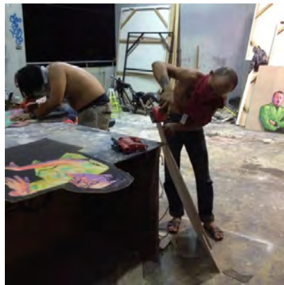
ภาพที่9 วิธีการตัดชิ้นส่วนของเส้นรอบนอกของภาพบุคคล