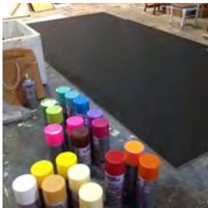
ภาพที่6 การเตรียมอุปกรณ์สีพ่นและวัสดุที่รองรับ

5.สร้างผลงานด้วยเทคนิคภาพพิมพ์ลายฉลุเตรียมวัสดุแผ่นกระดาษอัดที่ใช้รองรับที่พ่นสีสเปรย์ลงไปแล้วนำแม่พิมพ์ที่ตัดเสร็จเรียบร้อยแล้วมาพ่นตามสีที่กำหนดจนครบทุกแม่พิมพ์จากนั้นทำการใช้เครื่องมือเลื่อยตัดตามเส้นรอบนอกของภาพบุคคลนำส่วนที่ไม่ต้องการออก