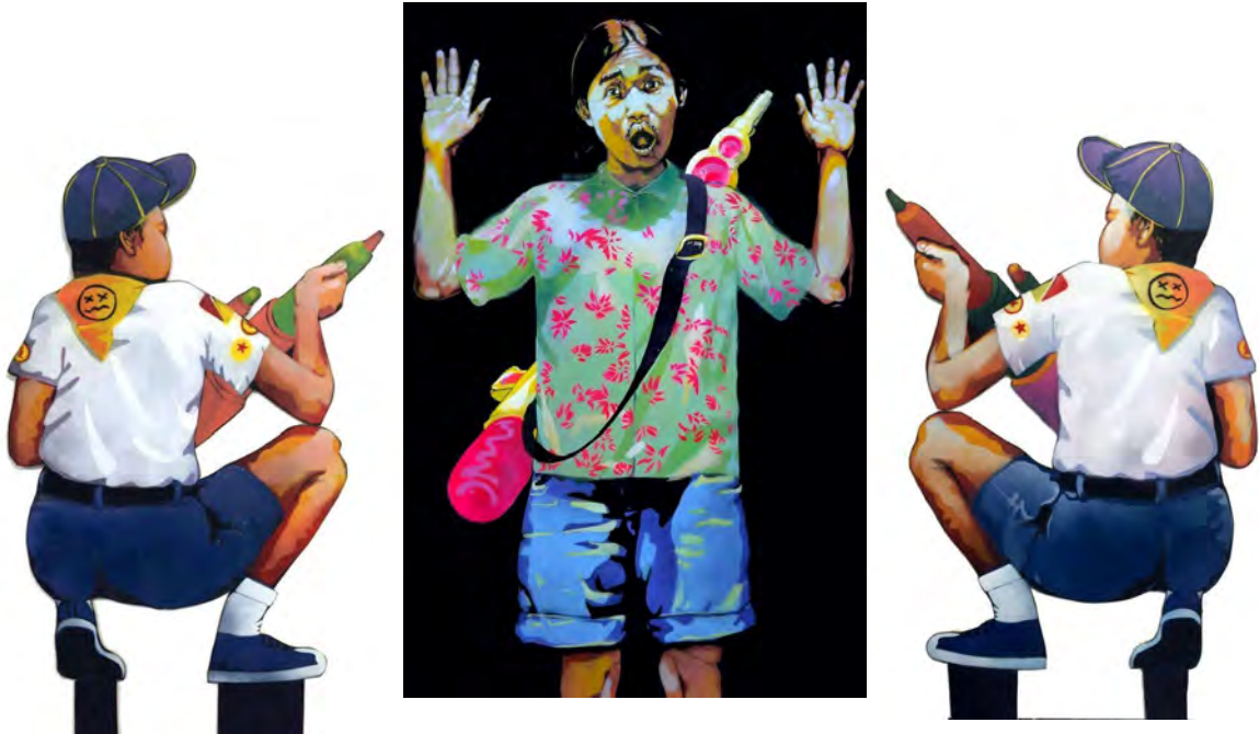
ภาพที่11 "ชูสองมือขึ้นฟ้า" เทคนิคแม่พิมพ์หลายฉลุนไม้ (Stencil on Wood) พ.ศ. 2558

การสร้างผลงานชิ้นนี้มาจากการศึกษารูปแบบงานศิลปะบนท้องถนน และได้พัฒนาเทคนิคภาพพิมพ์ต่าง ๆ จากการเรียนวิชาภาพพิมพ์ 3 มิติที่ได้มีโอกาสทดลองการใช้เทคนิคต่าง ๆ ในการสร้างสรรค์ผลงานซึ่งแนวความคิดในการสร้างผลงานมาจากความรุนแรงในสังคมที่ข้าพเจ้าอยากสะท้อนแง่มุมหนึ่งที่มีผลต่อตัวข้าพเจ้าโดยการถ่ายทอดผ่านรูปผลงานศิลปะโดยการใช้สัญลักษณ์ในการสื่อความหมายที่มีความขัดแย้งกันในผลงานชิ้นนี้เป็นการบอกเล่าผ่านการกระทำหรือท่าทางของตัวละครในภาพที่เลียนแบบมาจากเหตุการณ์ความรุนแรงแต่กลับมีสัญลักษณ์อื่นที่ทำให้เกิดภาพที่ตรงกันข้ามกับความรุนแรงแทนอย่างเช่นการใช้เสื้อลายดอกไม้ให้ดูสดใสน่ารัก และป็นฉีดยาน้ำแทนอาวุธปืนจริงโดยนำเสนอผ่านกระบวนการทางเทคนิคแม่พิมพ์หลายฉลุ