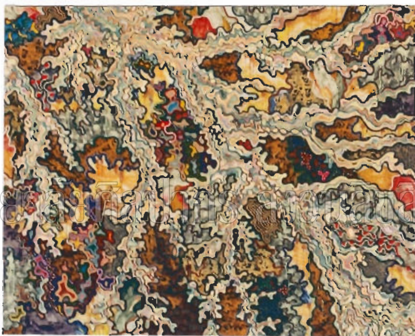
ภาพที่ 14 : ผลงานศิลปะนิพนธ์ระยยะที่ 1