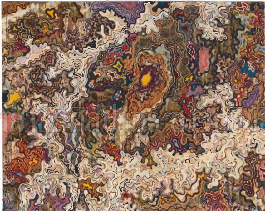
ภาพที่ 15 : ผลงานศิลปะนิพนธ์ระยะที่ 2