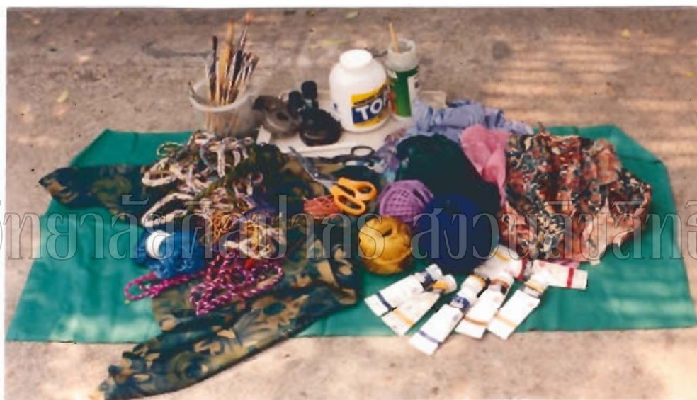
ภาพที่ ๕ : อุปกรณ์ที่ใช้ในการสร้างสรรค์