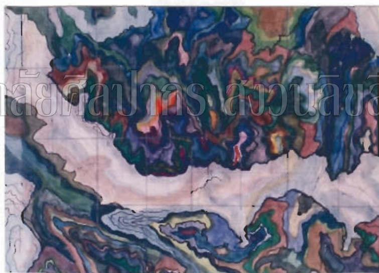
ภาพที่ ๕ : ภาพร่าง (SKETCH)