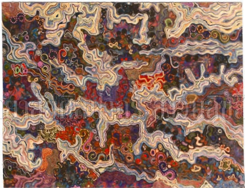
ภาพที่ 10 : ผลงานก่อนศิลปะนิพนธ์ระยะที่ 2