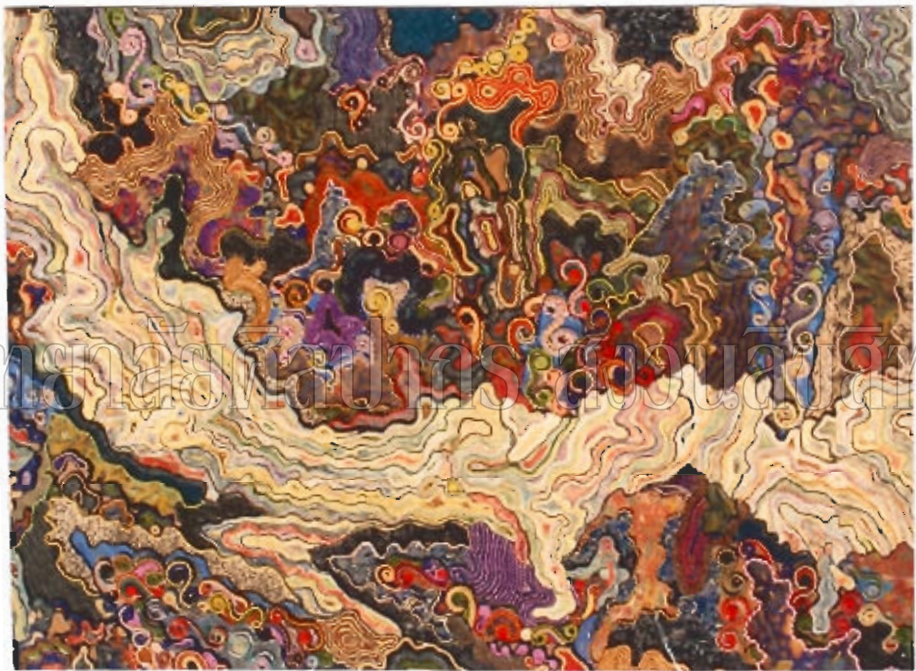
ภาพที่ ๑ : ผลงานก่อนศิลปะนิพนธ์ระยงที่ ๑