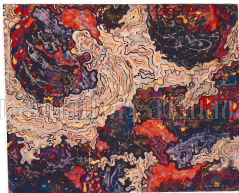
ภาพที่ 17 : ผลงานศิลปะนิพนธ์ระยะที่ 2