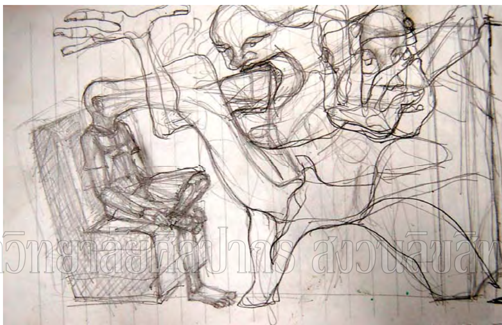
ภาพที่ 28 แบบร่าง 2 มิติ ผลงานชั้นที่ 4