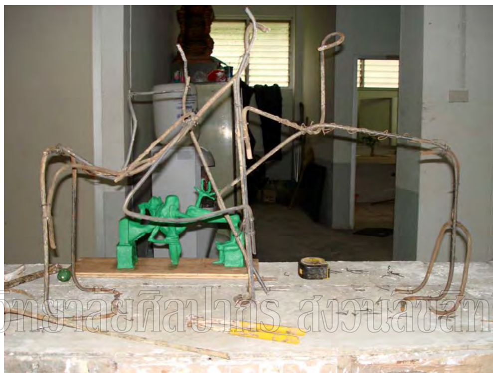
ภาพที่ 30 ขั้นตอนการขึ้นโครงสร้างเหล็ก ผลงานชั้นที่ 4