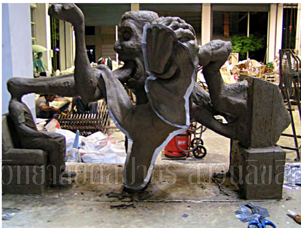
ภาพที่ 32 ขั้นตอนการปักแผ่นกั้นพิมพ์ ผลงานชิ้นที่ 4