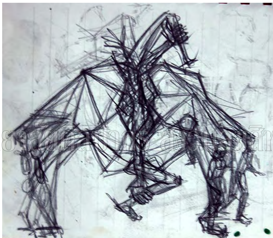
ภาพที่ 13 แบบร่าง 2 มิติ ผลงานชิ้นที่ 2