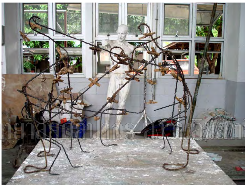
ภาพที่ 22 ขั้นตอนการขึ้น โครงสร้างเหล็ก ผลงานชิ้นที่ 3