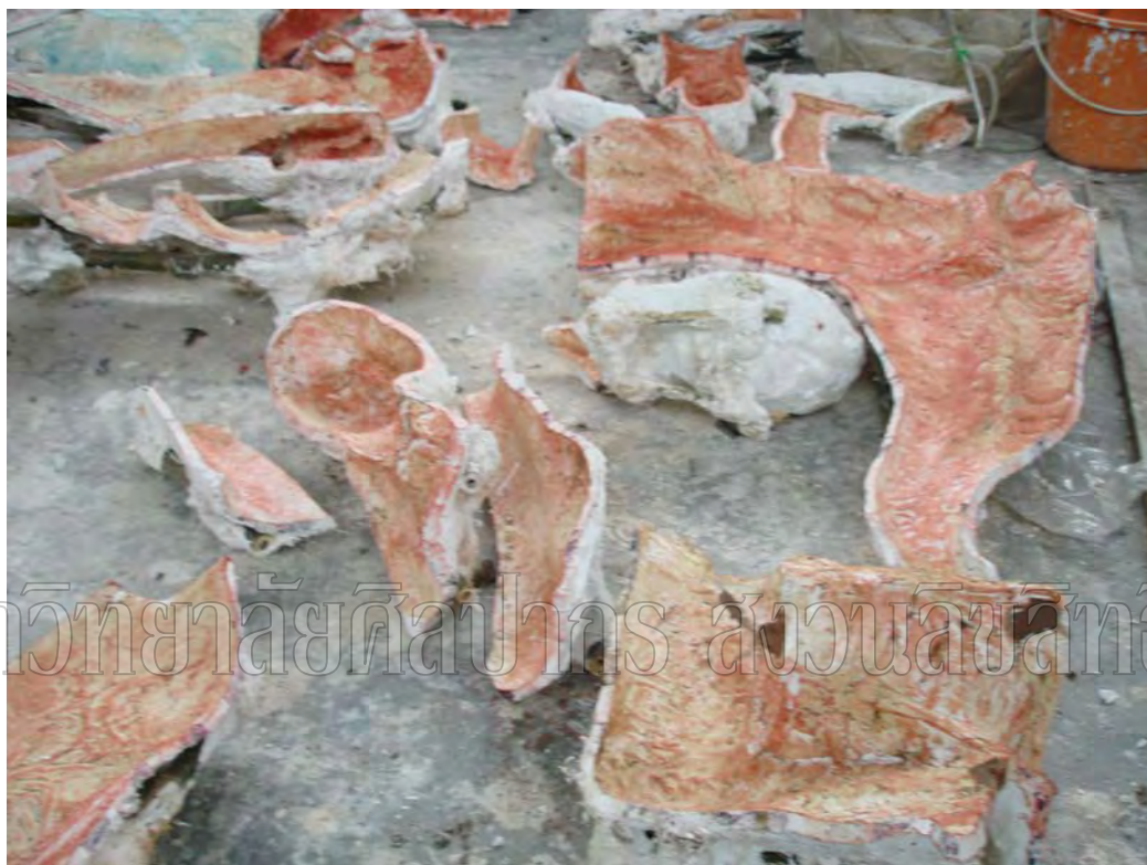
ภาพที่ 23 ขั้นตอนการทำพิมพ์ปูนปลาสเตอร์ ผลงานชิ้นที่ 3