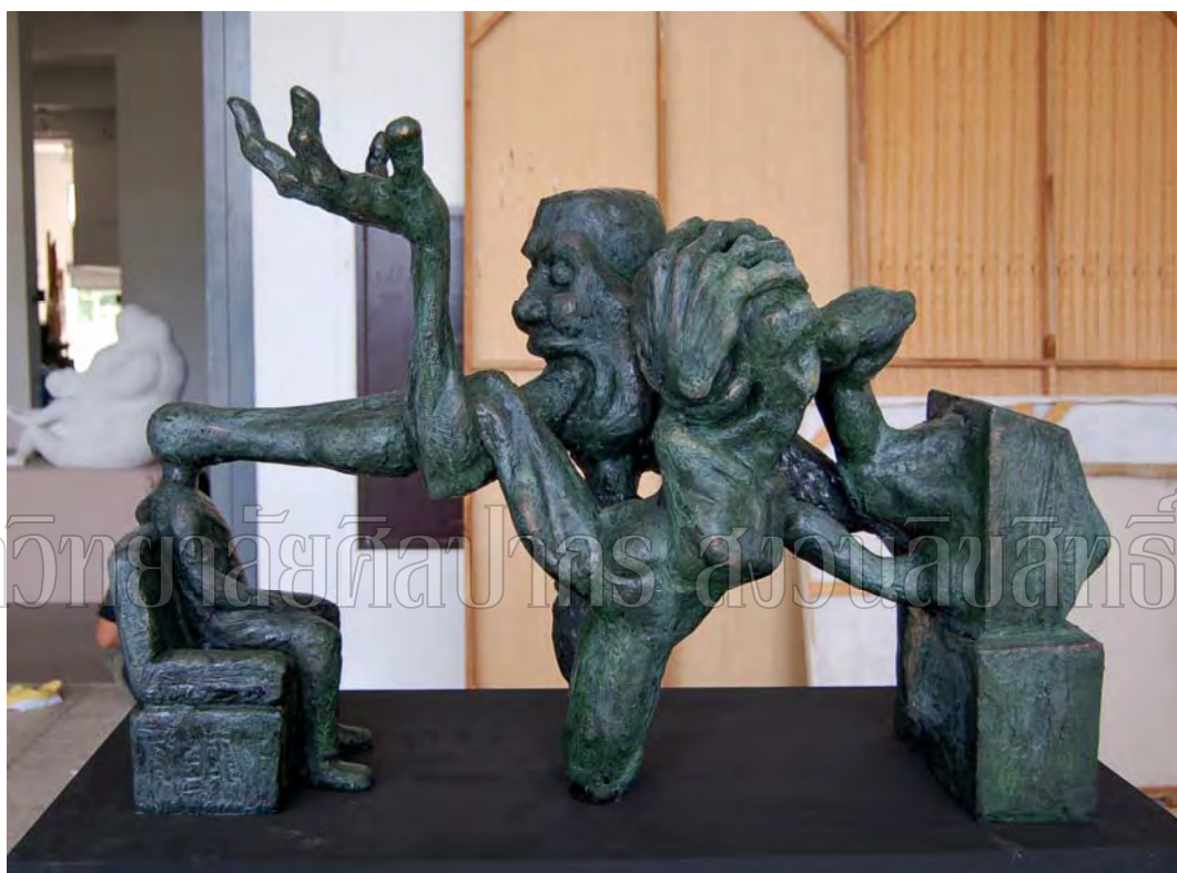
ภาพที่ 35 ภาพผลงานชิ้นที่ 4 ภาพที่ 3