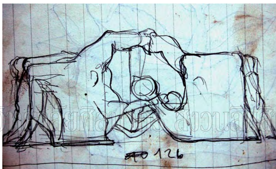
ภาพที่ 7 แบบร่าง 2 มิติ ผลงานชิ้นที่ 1