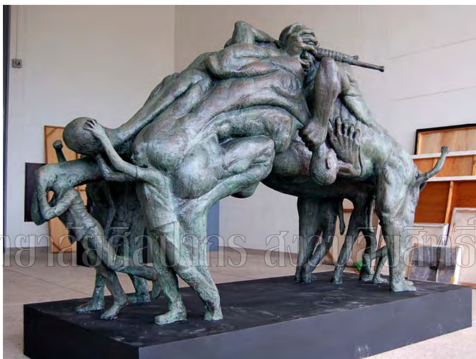
ภาพที่ 18 ภาพผลงานชิ้นที่ 2 ภาพที่ 2