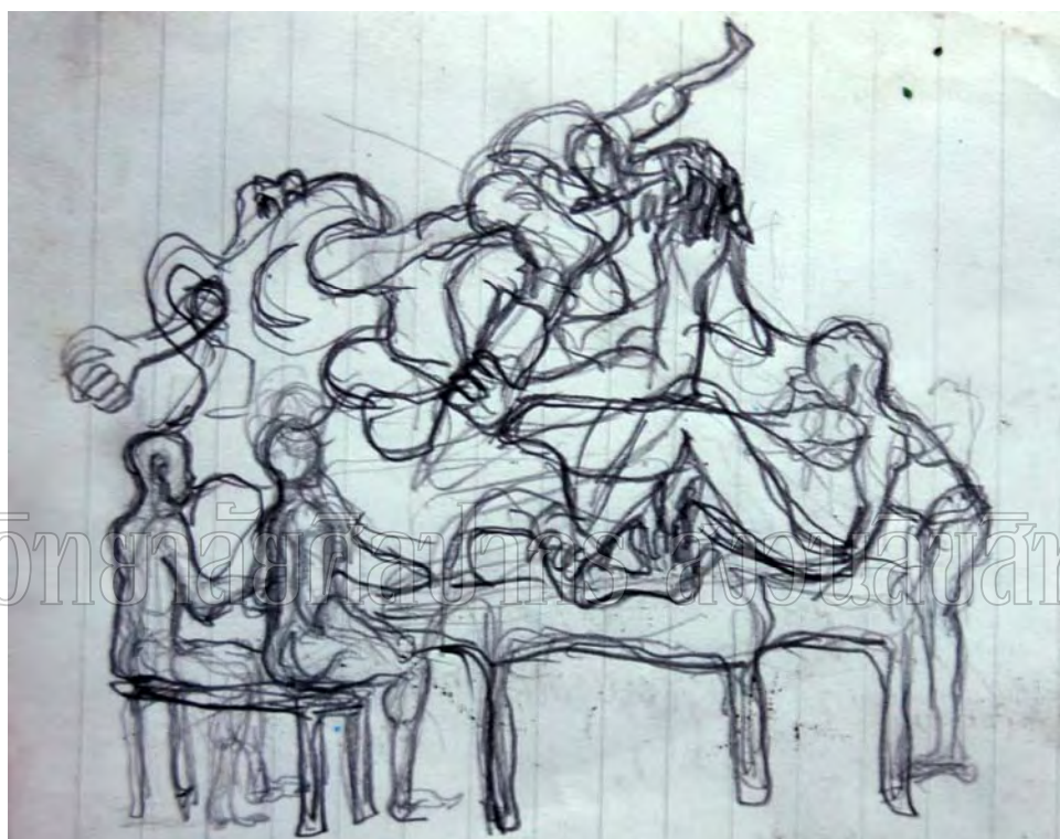
ภาพที่ 20 แบบร่าง 2 มิติ ของผลงานชิ้นที่ 3