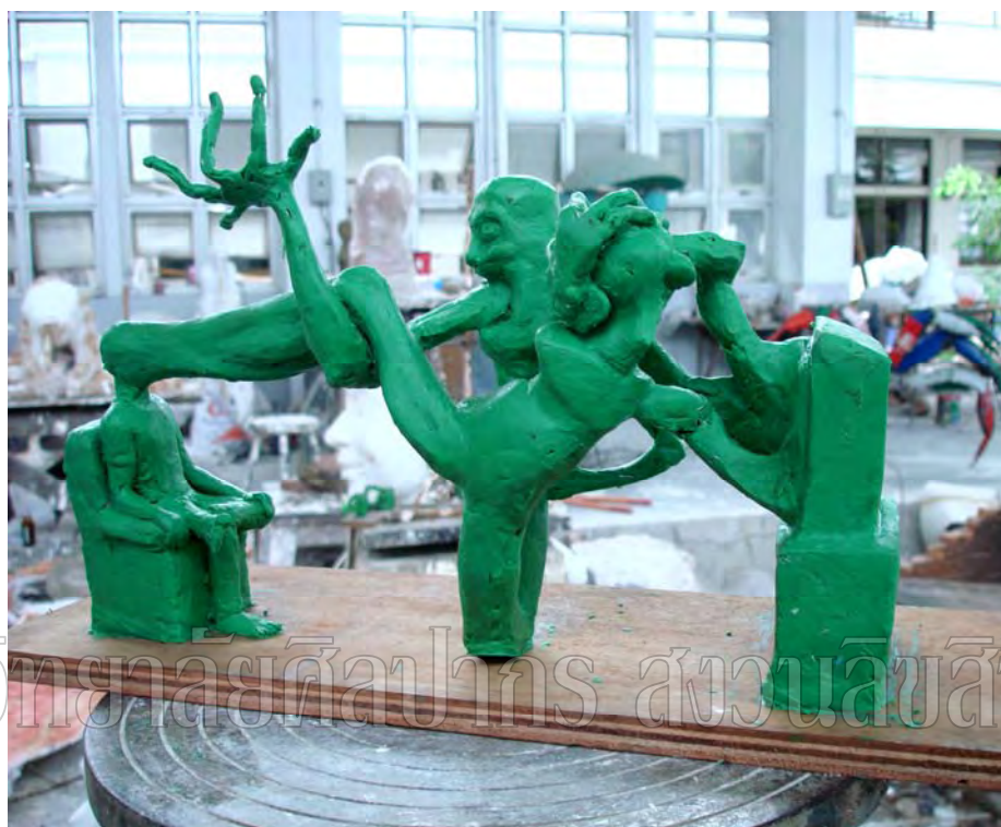
ภาพที่ 29 แบบร่าง 3 มิติ ผลงานชิ้นที่ 4