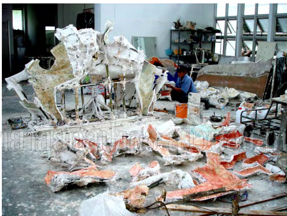
ภาพที่ 16 ขั้นตอนการทำพิมพ์ปูนปลาสเตอร์ ผลงานชิ้นที่ 2