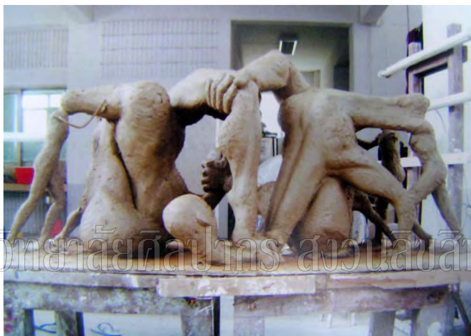
ภาพที่ 9 ขั้นตอนการปั้น ผลงานชิ้นที่ 1