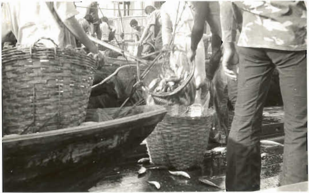
รูปที่ ๕. แสดงการตักปลาออกจากห้องเย็น.