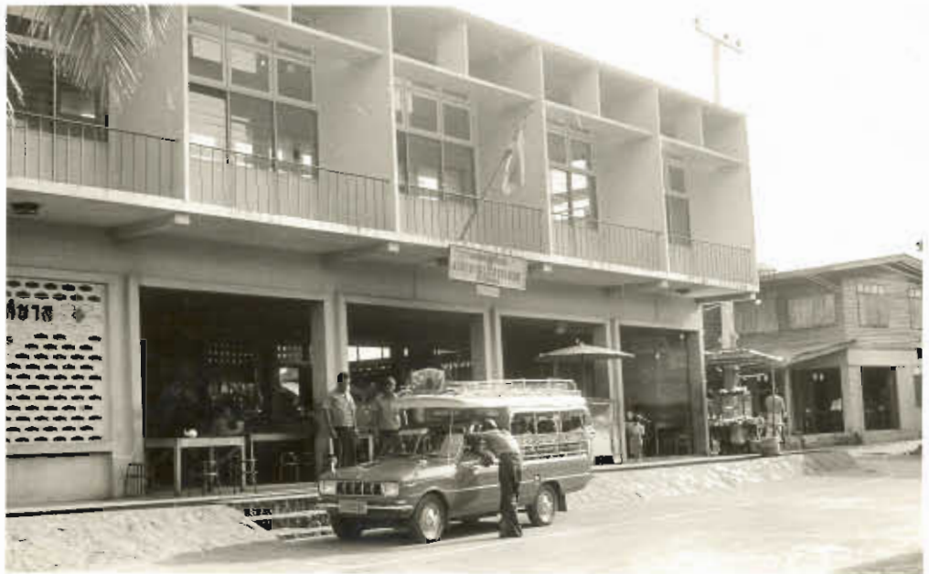
รูปที่ ๒ ตลาดสดท่าเทศบาล