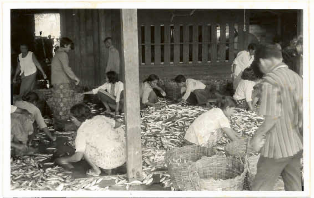
รูปที่ ๙, ๑๐. แสดงให้เห็นถึงการนับ และคัดเลือากปลา.