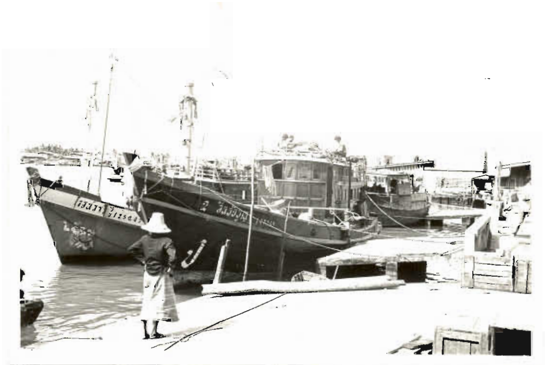
รูปที่ ๑๔. เรือที่จัดการทุกอย่างตามระเบียบ และพักผ่อนอยู่