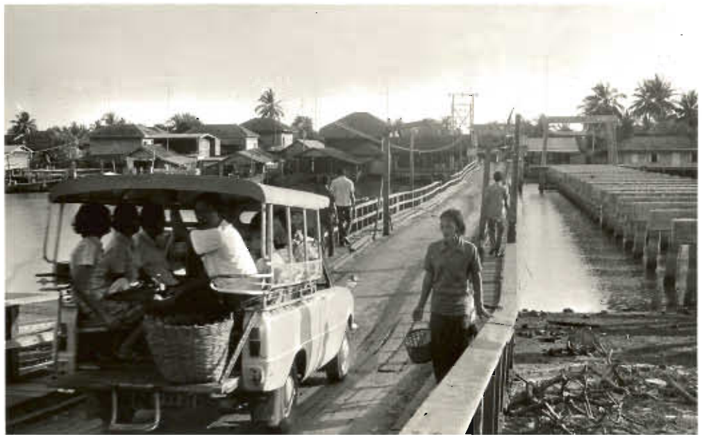
รูปที่ ๔. สะพานอริย์ราษฎร์ เชื่อมตำบลปากน้ำ กับตำบลท่าประตู