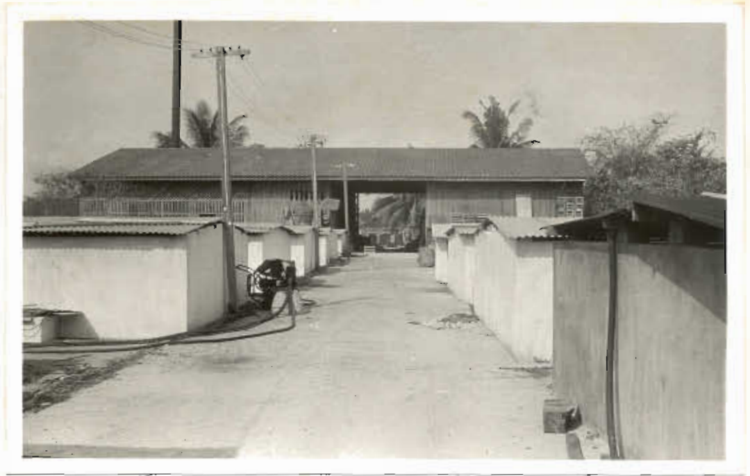
มหาวิทยาลัยศิลปากร ส่วนนิเทศน์ รูปที่ ๑๕, ๑๖. ทั้งสองภาพแสดงให้เห็นถึงบ่อน้ำปลาภายในเรือน้ำปลา.