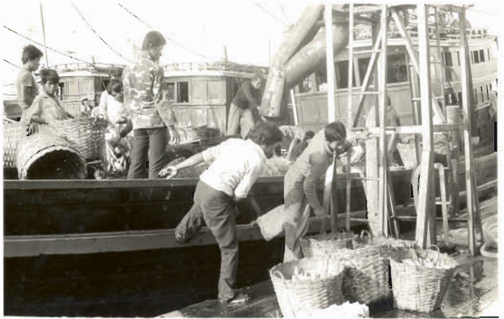
รูปที่ ๗. ลุงเรือช่วยกันขนปลาลงจากเรือ