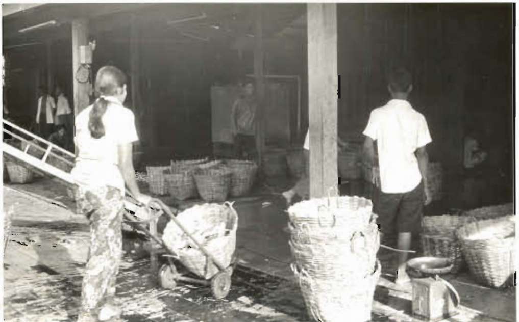
รูปที่ ๘. กำใส่ขยปลาเพื่อนำไปคัดเลือกร และนับจำนวน.