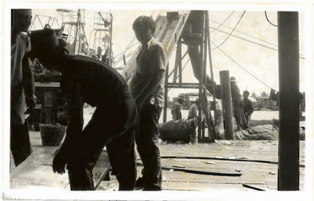
รูปที่ ๑๑. ลูกเรือกำลังใช้เครื่องบดน้ำแข็ง.