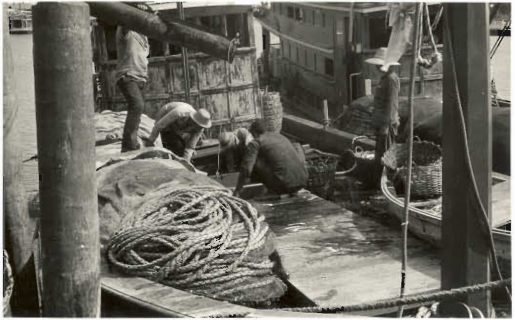
รูปที่ ๑๓. การจับทุกอย่างภายในเรือโดยทุกเรือช่วยกัน