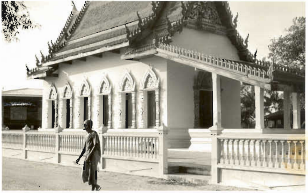
รูปที่ ๑ วัดปากน้ำ