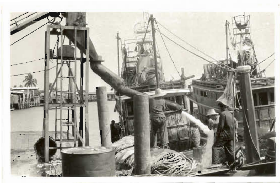
รูปที่ ๑๒. น้ำแข็งที่บดแล้วจะถูกบรรจุใส่ห้องเย็น