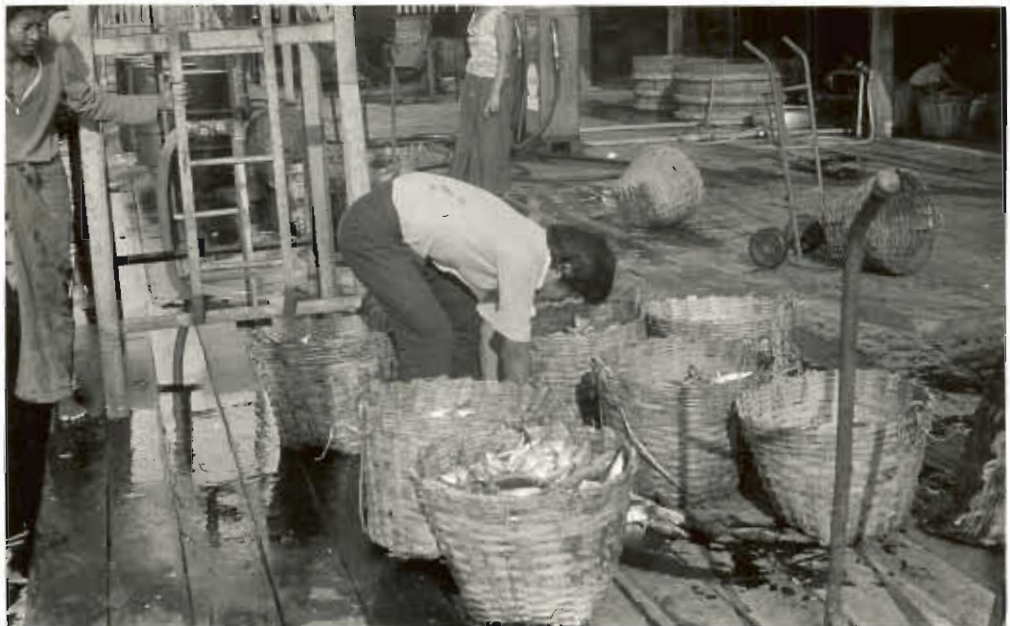
รูปที่ ๖. เก็บปลาที่ตกใส่เซ่ง