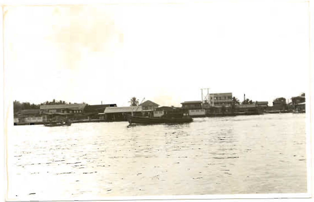
รูปที่ ๓. หมู่บ้านฝั่งตำบลปากน้ำ