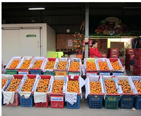
ภาพที่ 1 รูปแบบการจัดหน้าร้านค้าส่งผลไม้ค้าส่งในจังหวัดเพชรบุรี

“ร้านนี้จัดร้านดีนะ ดูน่ามอง แอปเปิ้ลก็วางเรียงสวย ที่แพคก็มองน่ากิน สะอาดดี ผลไม้ที่เค้าขายเค้าก็อวางเรียงเป็นระเบียบดูง่าย ป้ายราคาก็ติดชัดดี อันไหนถูกอันไหนแพงดูง่ายน่าซื้อดี ป้ามาซื้อ ไปขายช่วงวันพระวันโกณนะ เค้าดีนะอันไหนแพงอันไหนถูก ของดีไม่ตีเค้าก็บอกหมด ” (วารการนามสมมุติ, 2559)