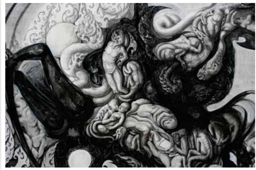
ภาพที่ 10 ภาพรายละเอียดผลงานระยาศิลปนิพนธ์ ชั้นที่ 1 มหาวิทยาลัยศิลปากร สงวนลิขสิทธิ์