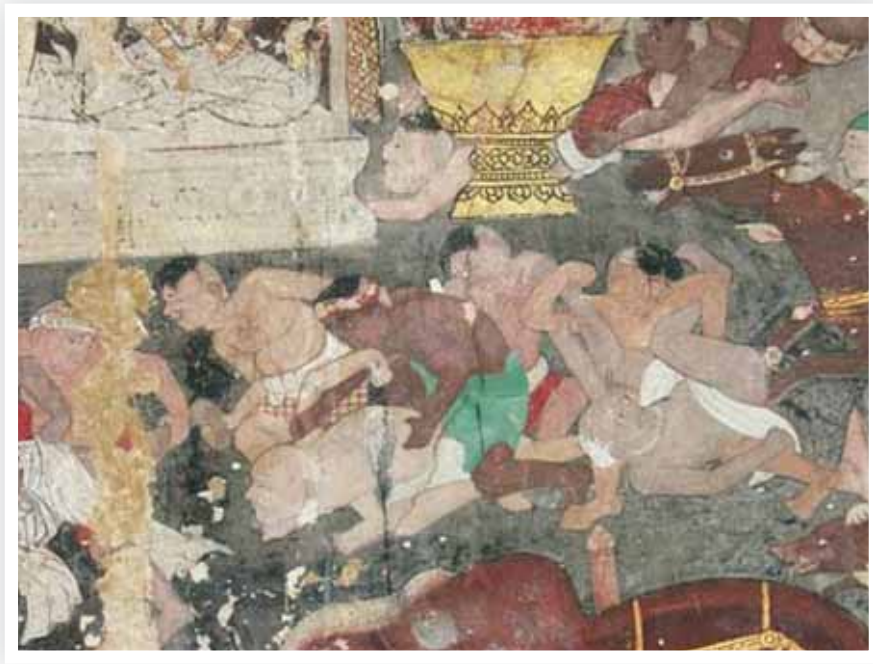
ภาพที่ 3 วัดสุวรรณาราม เรื่องจันทกุมารชาดก