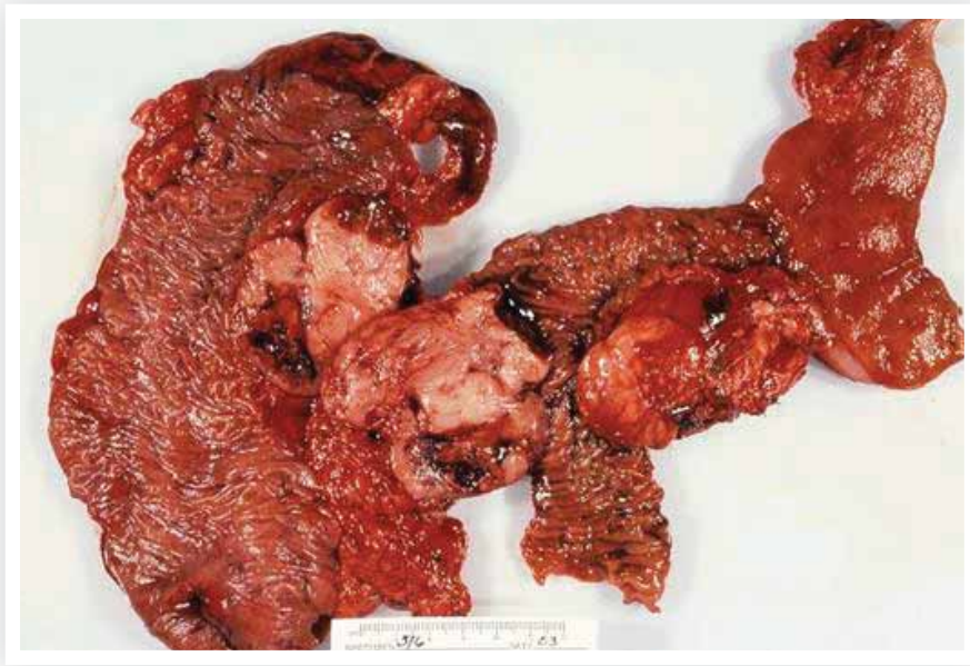
ภาพที่ 2 ก้อนเนื้อร้าย