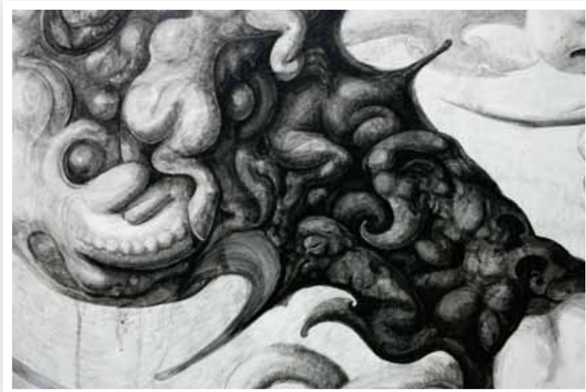
ภาพที่ 13 ภาพรายละเอียดผลงานระยะศิลปนิพนธ์ ชั้นที่ 2