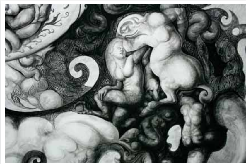
ภาพที่ 14 ภาพรายละเอียดผลงานระยะศิลปนิพนธ์ ชั้นที่ 2