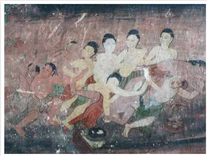
ภาพที่ 4 จิตรกรรมฝาผนัง วัดสุวรรณาราม