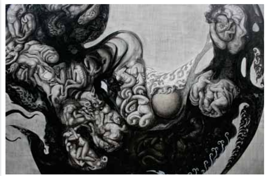
ภาพที่ 11 ภาพรายละเอียดผลงานระยาศิลปนิพนธ์ ชั้นที่ 1