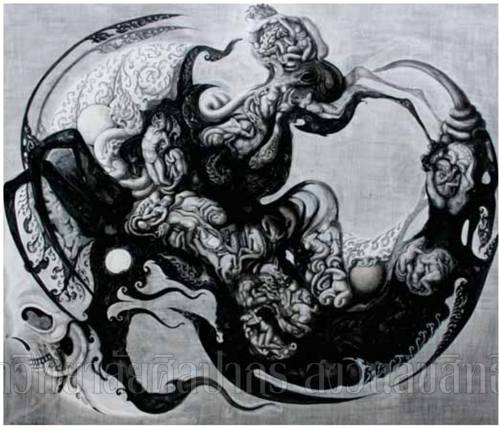
ภาพที่ 6 ขั้นตอนการสร้างผลงานศิลปนิพนธ์ (ภาพงานที่สมบูรณ)