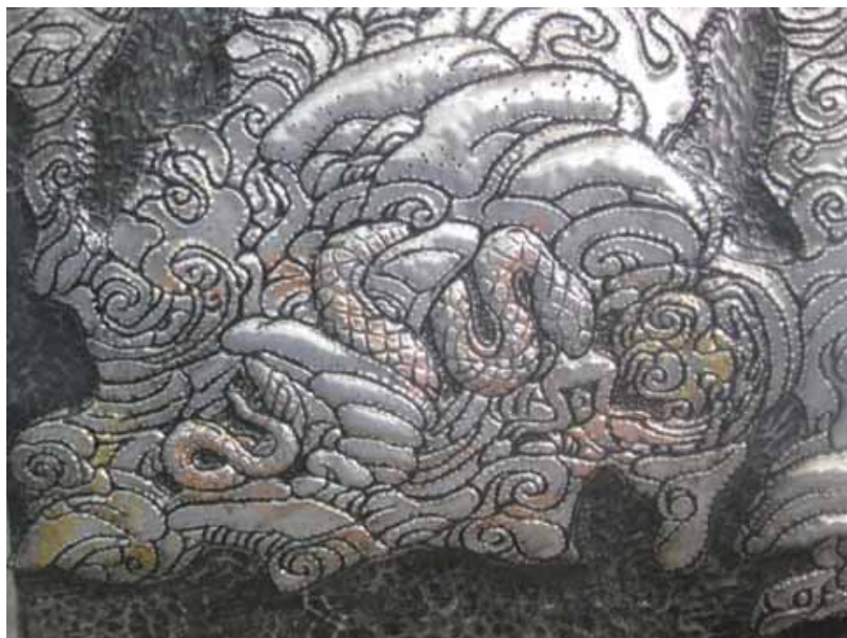
ภาพที่ 28 รายละเอียดผลงานศิลปนิพนธ์