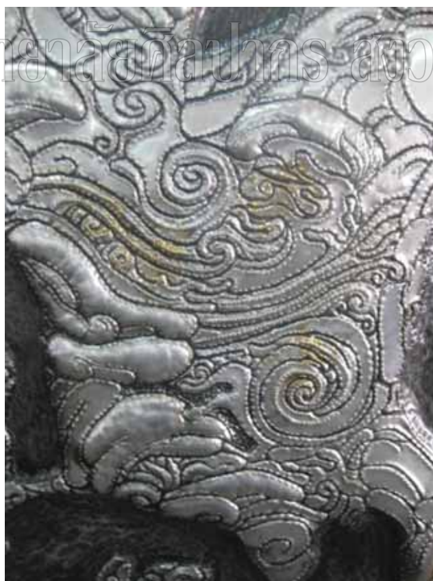
ภาพที่ 31 รายละเอียดผลงานศิลปนิพนธ์