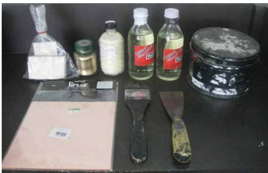
ภาพที่ 20 อุปกรณ์ในการทำสี