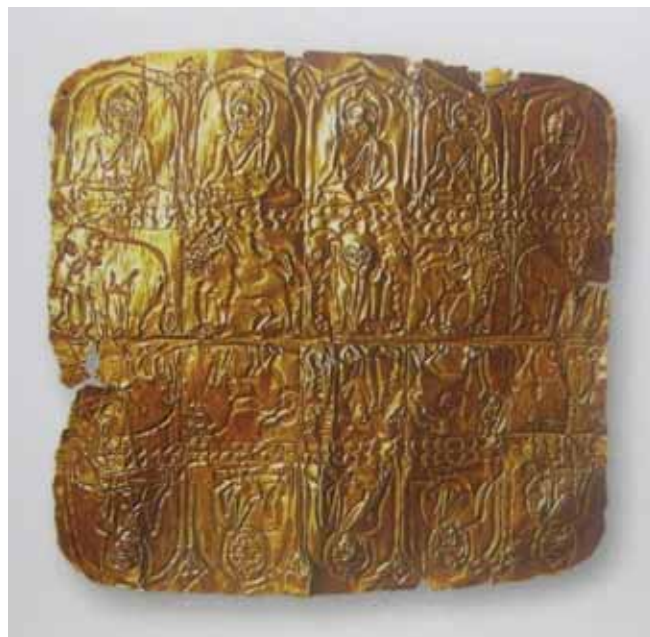
ภาพที่ 7 แผ่นทองคำนูน กรุวัดราชบูรณะ