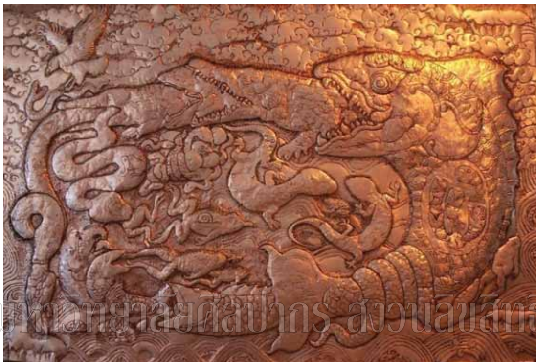
ภาพที่ 8 ชื่อภาพ วัชรจักรแห่งชีวิต ขนาด 120 x 180 ซม. เทคนิค คุณโลหะ