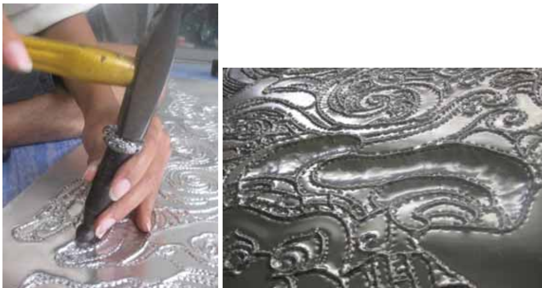
ภาพที่ 23 ขั้นตอนการสร้างสรรค์ผลงาน การดุนโลหะ