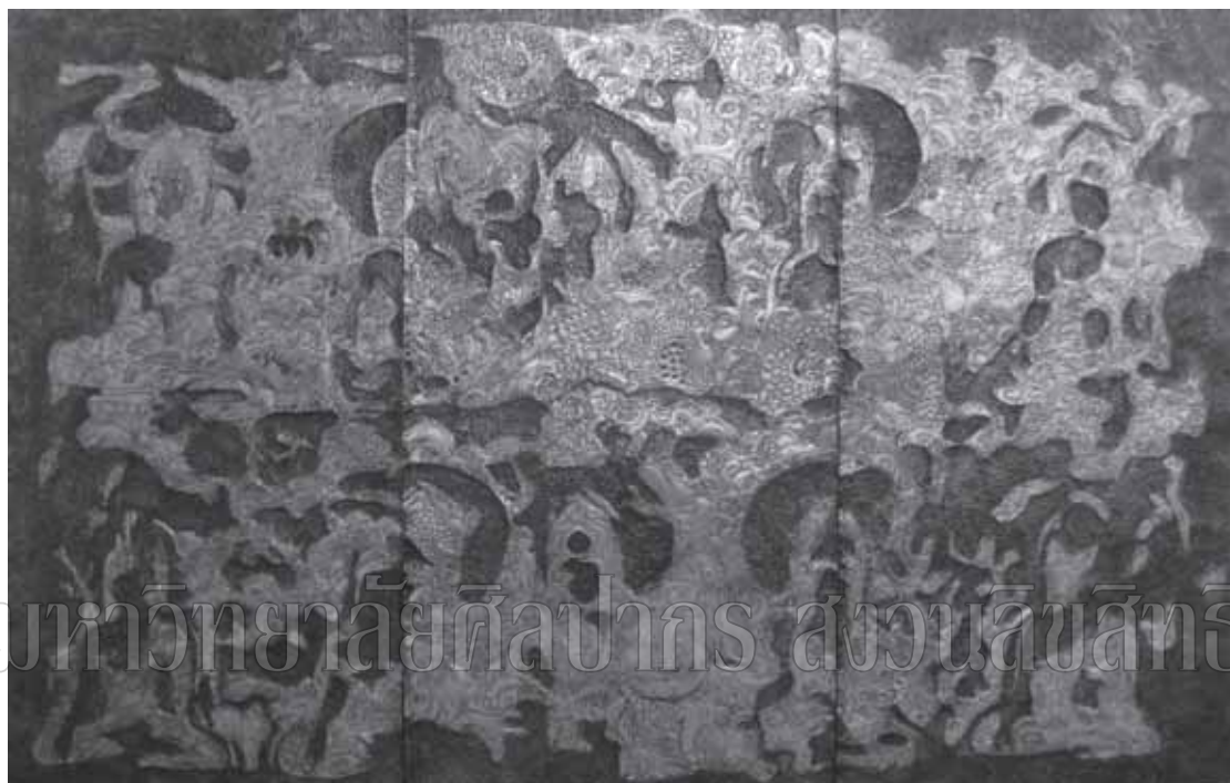
ภาพที่ 16 ชื่อภาพ ร่องรอยของกาลเวลา ๒ ขนาด 224 x 366 ซม. เทคนิค ดุนโลหะ