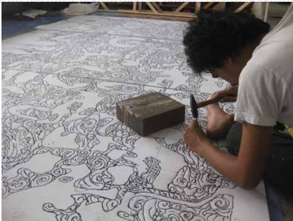
ภาพที่ 22 ขั้นตอนการสร้างสรรค์ผลงาน การตอกลายเส้น