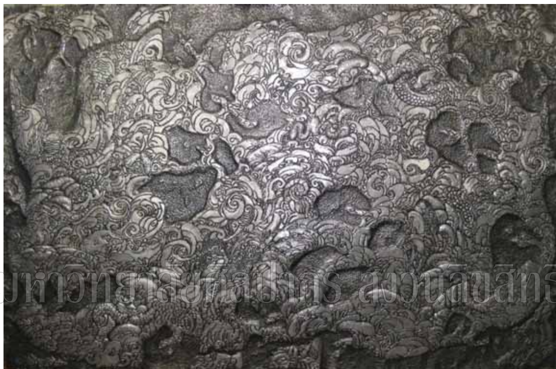
ภาพที่ 15 ชื่อภาพ ร่องรอยของกาลเวลา ๑ ขนาด 120 x 180 ซม. เทคนิค ดุนโลหะ