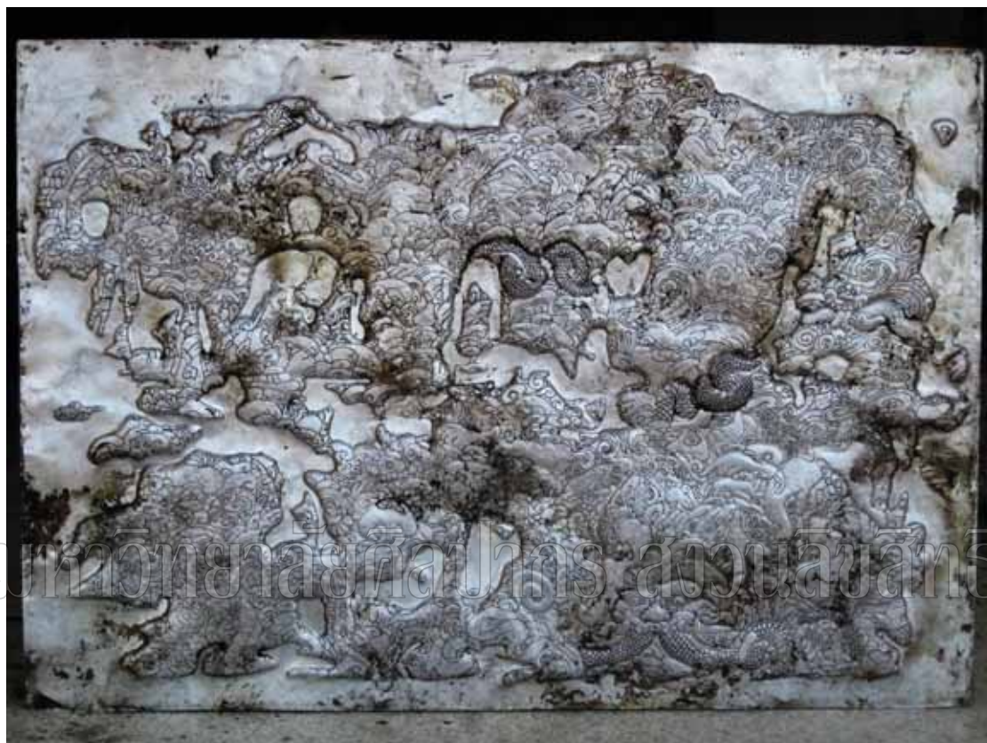
ภาพที่ 11 ชื่อภาพ กาล ๒ ขนาด 110 x 160 ซม. เทคนิค ดุนโลหะ