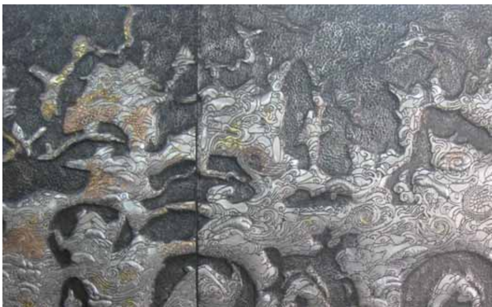
ภาพที่ 30 รายละเอียดผลงานศิลปนิพนธ์