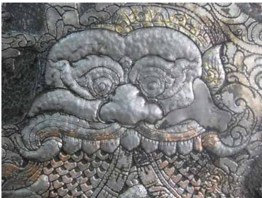
ภาพที่ 26 รายละเอียดผลงานศิลปนิพนธ์ มหาวิทยาลัยศิลปากร สงวนลิขสิทธิ์