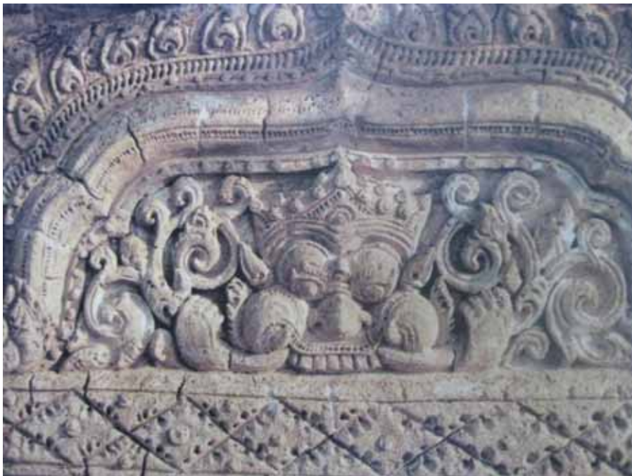
ภาพที่ 3 ลวดลายซุ้มปราสาท วัดสัม