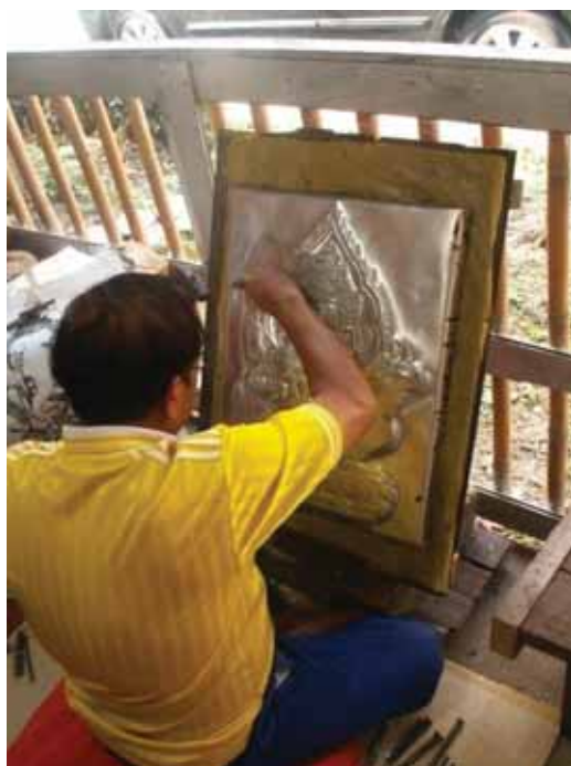
ภาพที่ 4 ช่างคุณโลหะ หมู่บ้านจัวลาย