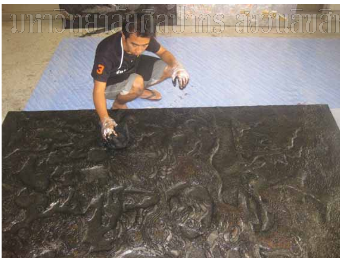
ภาพที่ 24 ขั้นตอนการสร้างสรรค์ผลงาน การทำสี