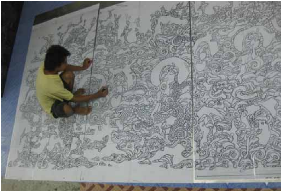
ภาพที่ 21 ขั้นตอนการสร้างสรรค์ผลงาน การขยายภาพร่างลงบนแผ่นอะลูมิเนียม มหาวิทยาลัยศิลปากร สงวนลิขสิทธิ์