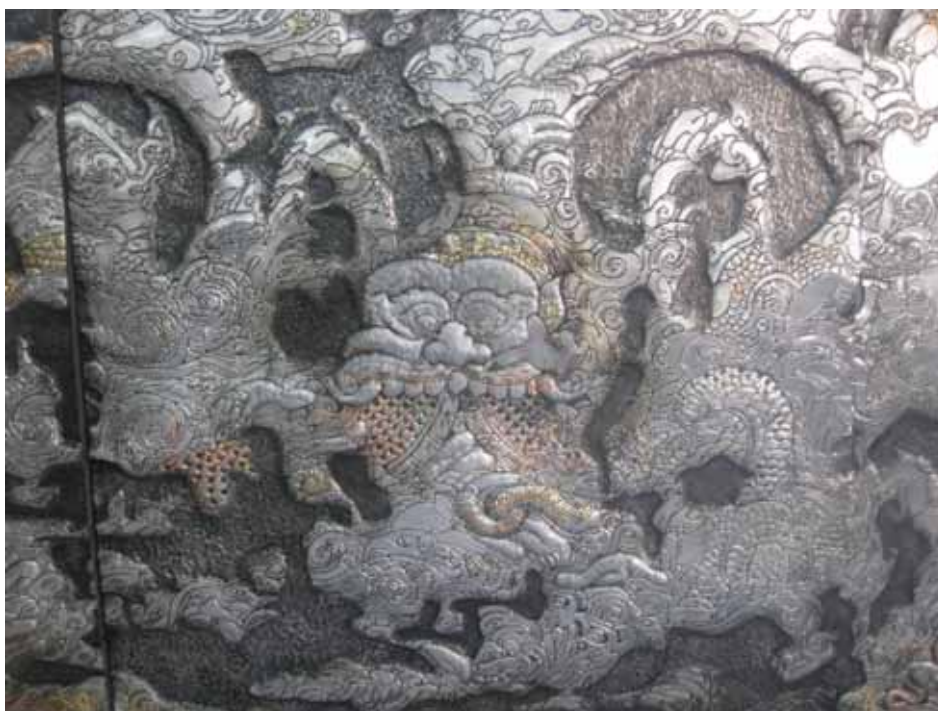
ภาพที่ 27 รายละเอียดผลงานศิลปนิพนธ์