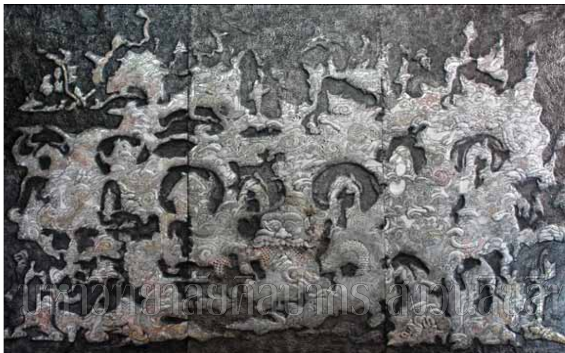
ภาพที่ 25 ชื่อภาพ รอยธรรม ขนาด 225 x366 ซม. เทคนิค คุณโลหะ