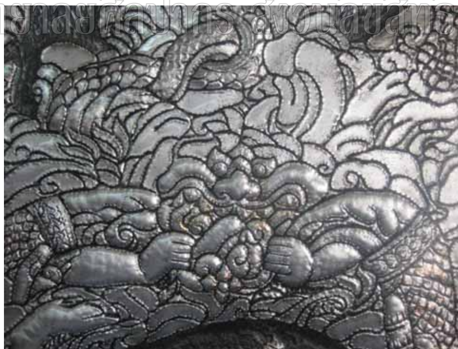
ภาพที่ 29 รายละเอียดผลงานศิลปนิพนธ์