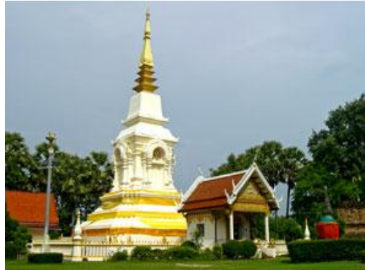
ภาพประกอบที่ 2 พระธาตุบังพวน จ.หนองคาย

พระธาตุบังพวน เป็นพระธาตุเจดีย์ที่เก่าแก่และสำคัญยิ่งของจังหวัดหนองคาย เป็นพระธาตุที่สำคัญองค์หนึ่งของภาคอีสาน อาคารเสนาสนะประกอบด้วยอุโบสถโบราณ ศาลาการเปรียญ หอสวดมนต์ กุฏิสงฆ์ ปูชนียวัตถุมีพระธาตุบังพวนบรรจุอัฐิองค์สัมมาสัมพุทธเจ้า พระปรารภ 3 องค์ เจดีย์เล็ก 7 องค์ พระพุทธรูปพระประธานใหญ่ และพระนาคปรกขนาดใหญ่