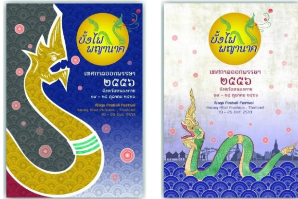
ภาพประกอบที่ 6 โปสเตอร์งานเทศกาลออกพรรษาข้งไฟพญานาค