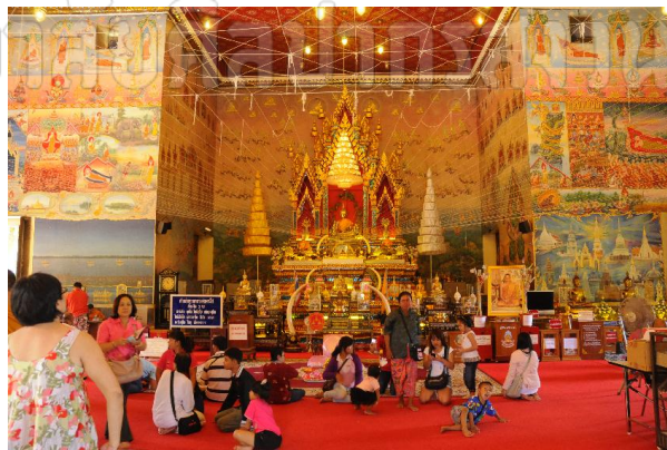
ภาพประกอบที่ 1 หลวงพ่อพระใส วัดโพธิ์ชัย

วัดโพธิ์ชัยมีประวัติเกี่ยวข้องกับตำนานและประวัติศาสตร์ของ 2 ประเทศคือ ประเทศไทย และ ประเทศสาธารณรัฐประชาธิปไตยประชาชนลาว โดยมีความเชื่อมโยงกับพระพุทธรูปสำคัญของอาณาจักรล้านช้าง เวียงจันทน์ คือ พระสุก พระเสริม พระใส