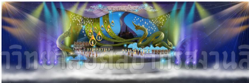
ภาพประกอบที่ 5 แบบโครงสร้างภายในเวที การจัดแสดงโรงละครนาคนาถุมิตร

โรงละครนาคนาถุมิตร (ขนาด 500 ที่นั่ง) เพื่อเป็นสถานที่ท่องเที่ยวแห่งใหม่ และเป็นพื้นที่แสดงเรื่องราว ประวัติศาสตร์ เหตุการณ์สำคัญต่างๆ ของจังหวัดหนองคาย