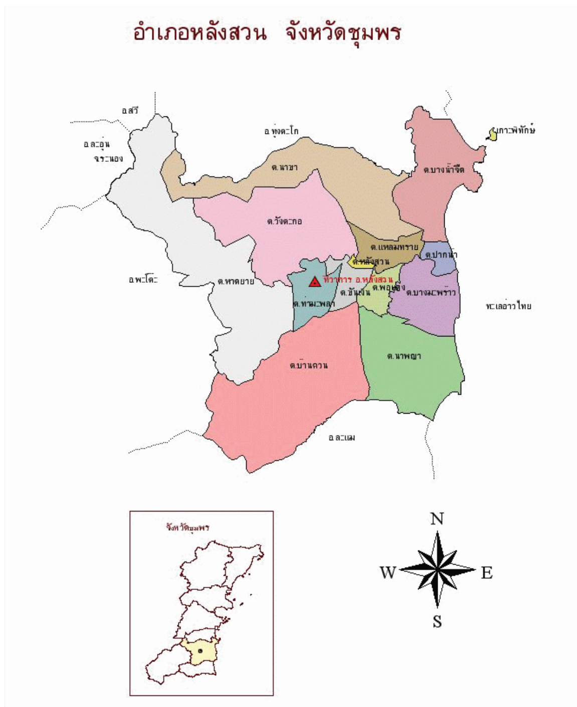
ภาพที่ 1 พื้นที่ศึกษาร้านเกาะพิทักษ์ ตำบลบางน้ำจืด อำเภอหลังสวน จังหวัดชุมพร