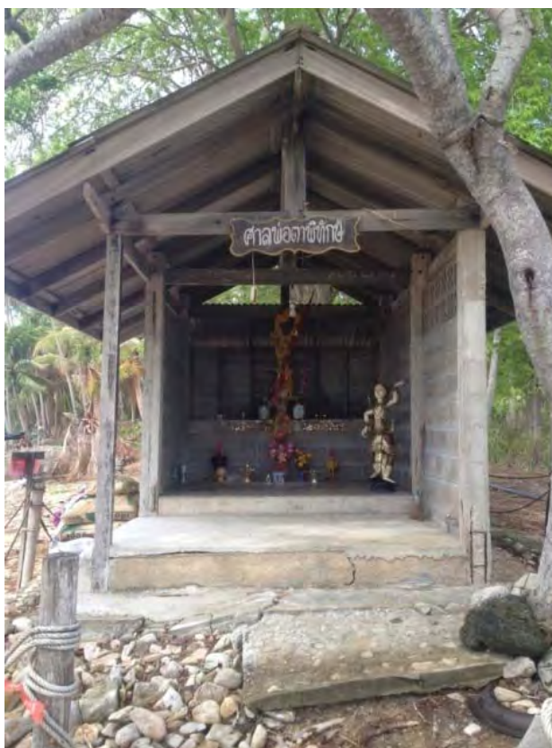
ภาพที่ 8 ศาลพ่อตาเกาะพิทักษ์

เมื่อปี 2542 เป็นปีแรกที่ผมจัดวิ่งแหวกทะเล ก็มีคนพูดเล่นกันว่าชวนพ่อตาไปเที่ยวที่ฝั่ง แต่ไม่ได้ชวนพ่อตาคลับฝั่ง พอตกลงวงเย็นป่าเขาฝัน และมาบอกผมว่าให้ไปรับพ่อตาคลับมาฝั่งด้วย ถ้าพ่อตาไม่กลับจะเกิดภัยพิบัติบนเกาะ ผมก็ไม่เชื่อ พอรุ่งขึ้นป่าก็มาบอกผมเหมือนเดิม วันที่ผมต้องเข้ากม. พายุก็เข้าเกาะพิทักษ์ พังทั้งเกาะ ผมกลับมาก็เลย จุฑรูปเทียน ขอขมาพ่อตา หลังจากนั้นเราก็ตีขึ้น (อำพล ธานีกรูท, 2557)