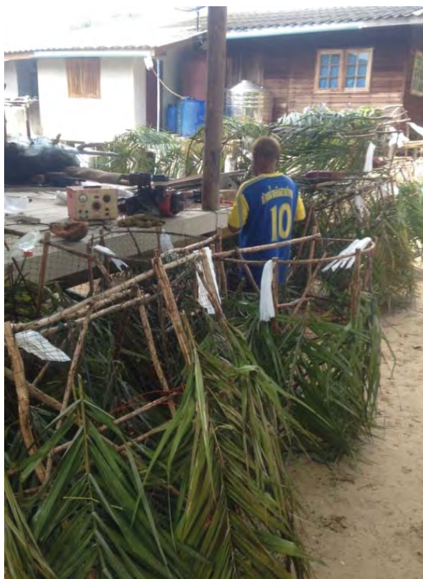
ภาพที่ 9 ลอบที่ใช้ในการจับปลาหมึก

ภูมิปัญญาท้องถิ่นของเรามีปลาเค็มฝงทราย แต่ตอนนี้ทำกันเพียงแค่นี้ก็หลังแล้ว เหมือนว่าการทำปลาเค็มฝงทราย จะมีป่าคนึงทำ ถ้าหากป่าคนึงนี้ไม่อยู่ ก็คือจะไม่มีคนทำ ปัญหาของตอนนี้คือ ไม่มีคนมาสืบทอด (สมวาสนา ทิพย์แสง, 2557)