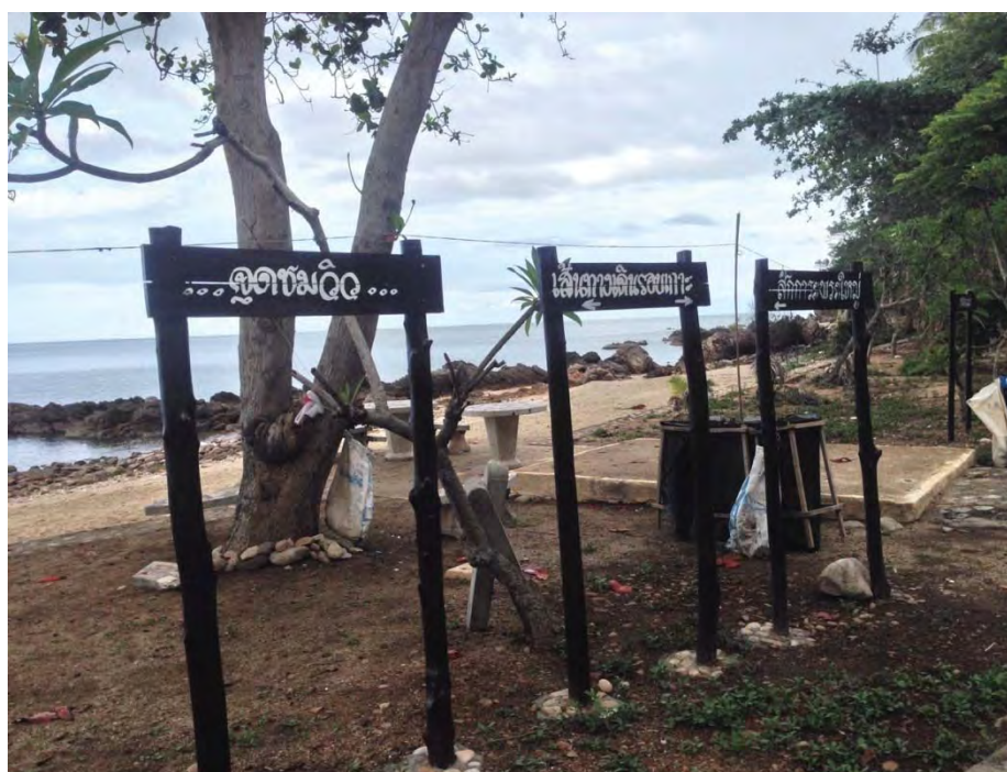
ภาพที่ 12 แสดงป้ายบอกเส้นทางเดินชมรอบเกาะ

เกาะพิทักษ์เป็นแหล่งท่องเที่ยวเชิงอนุรักษ์ ที่ตั้งอยู่ไม่ไกลจากฝั่งมากนัก ซึ่งนักท่องเที่ยวสามารถเข้ามาท่องเที่ยวได้โดยใช้เวลาการเดินทางมาที่เกาะไม่เกิน 15 นาที ชุมชนบ้านเกาะพิทักษ์มีสภาพแวดล้อมที่อุดมสมบูรณ์ และมีวิถีชีวิตดั้งเดิม ชาวบ้านบนเกาะพิทักษ์ใช้ชีวิตกันอย่างเรียบง่าย บนเกาะพิทักษ์นั้นมีทรัพยากรป่าไม้ที่น่าสนใจอยู่บนภูเขาของเกาะ นักท่องเที่ยวสามารถเดินชมทรัพยากรต่างๆเหล่านั้นได้ และมีป้ายบอกทางตลอดเส้นทางเดินชมรอบเกาะ บนเกาะพิทักษ์มีต้นไม้หลายชนิด และแต่ละต้นก็จะมีติดชื่อบอกให้นักท่องเที่ยวไว้ศึกษาธรรมชาติบนเกาะ เมื่อนักท่องเที่ยวขึ้นไปถึงยอดของเกาะพิทักษ์ซึ่งเป็นจุดชมวิว นักท่องเที่ยวสามารถมองเห็นได้รอบเกาะพิทักษ์ ซึ่งเป็นทัศนียภาพที่มีความสวยงาม