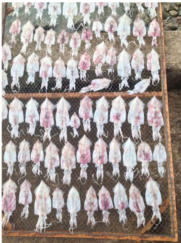
ภาพที่ 6 ปลาหมึกแห้งซึ่งเป็นผลิตภัณฑ์แปรรูปอาหารทะเล

2.2.2 กลุ่มโฮมสเตย์ จัดตั้งขึ้นเมื่อปีพ.ศ. 2538 จัดตั้งขึ้นเพื่อพัฒนาชุมชนให้เป็นแหล่งท่องเที่ยว เพิ่มขีดความสามารถของชุมชนเพื่อการเป็นแหล่งท่องเที่ยวเชิงอนุรักษ์ สร้างงานเพิ่มรายได้แก่คนในชุมชน โดยให้สมาชิกในกลุ่มเป็นผู้ถือหุ้น ปัจจุบันมีบ้านที่เป็นโฮมสเตย์ทั้งหมด 20 หลังคาเรือน การเข้าพักนั้นประธานกลุ่มจะจัดสรรให้โฮมสเตย์แต่ละตามลำดับ หรือนักท่องเที่ยวสามารถติดเข้าพักโฮมสเตย์ได้โดยตรงที่เจ้าของบ้านพัก รายได้จากการเข้าพักโฮมสเตย์ของนักท่องเที่ยว เจ้าของบ้านต้องจ่ายสมทบเข้าเงินกองทุนของกลุ่มในอัตราร้อยละ 3 จากการสัมภาษณ์ผู้ให้ข้อมูลหลัก ได้ให้ข้อมูลการจัดตั้งโฮมสเตย์ดังนี้