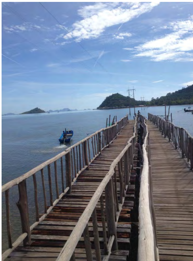
ภาพที่ 5 ท่าเรือจากฝั่งไปสู่เกาะพิทักษ์