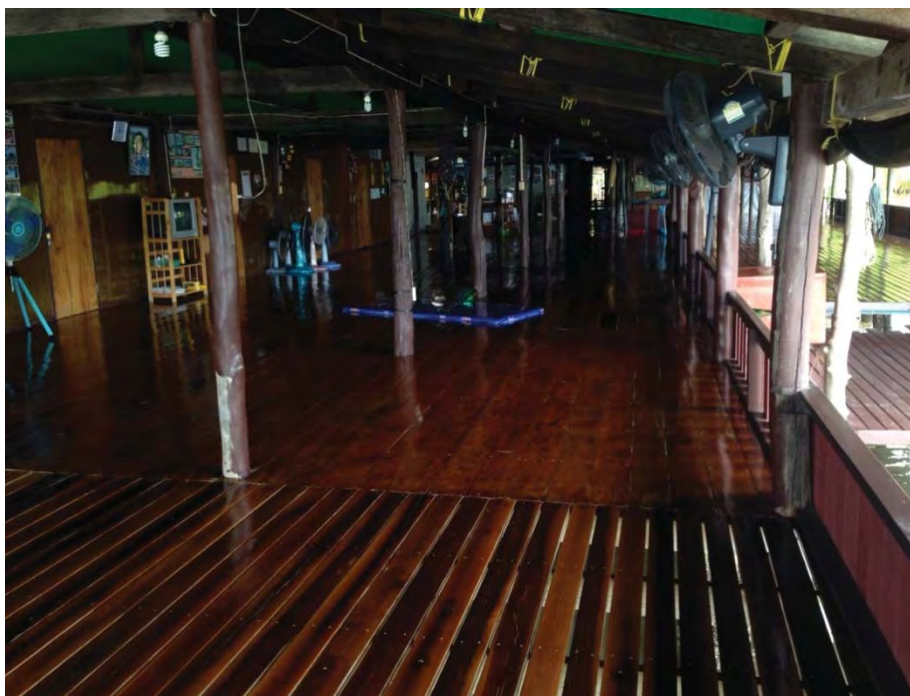
ภาพที่ 7 แสดงโฮมเสตย์บ้านเกาะพิทักษ์

มาจากการที่เพื่อนๆ มาเที่ยวที่บ้านบ่อย ก็เลยคิดว่าจะทำอย่างไรเพื่อหารายได้ให้กับแม่บ้าน จนเกิดเป็นโฮมเสตย์ขึ้นมา โดยที่ผมนั่งคิดกันกับเพื่อนๆ ครั้งแรกเลย คือเก็บคนละ 100 บาท คินแรกมีเพื่อนมาทั้งหมด 22 คน ได้เงินทั้งหมด 2,200 บาท หลังจากวันนั้นก็เรียกชาวบ้านมาประชุม เรื่องการท่องเที่ยว พวกเราทำกันเองมาเป็นเวลา 3 ปี เชิญหน่วยงานรัฐเข้ามาก็มีแต่ปฏิเสธ ผมเลยพยายามด้วยตัวเอง ก็เลยพาชาวบ้านไปดูงานที่บ้านคีรีวง นครศรีธรรมราช ตอนนั้นชาวบ้านก็ไม่มีใครเห็นด้วย ผมก็เลยให้ผู้ช่วยเริ่มทำกันก่อน 2 คน เริ่มทำแบบง่ายๆ ทำมาเรื่อยๆ จนกระทั่งเมื่อวันที่ 15 พ.ค. 2542 ได้ปิดอ่าว ฟันฟูเกาะพิทักษ์ สื่อต่างๆก็เข้ามาทำข่าว หลังจากนั้นเกาะพิทักษ์ก็เริ่มมีชื่อเสียง นักท่องเที่ยวก็เริ่มเข้ามาเกาะพิทักษ์มากขึ้น (อำพล ธานีครุฑ, 2557)