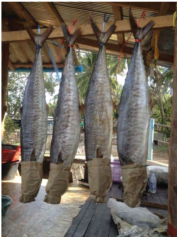
ภาพที่ 10 ปลาเค็มฝึงทรายซึ่งเป็นภูมิปัญญาในการแปรรูปอาหารของชาวบ้าน

ประเพณีท้องถิ่นของเกาะพิทักษ์ คือ 1) ประเพณีสวดหาต ประเพณีสวดหาตเป็นการทำบุญเกาะประจำปี เพื่อเป็นการขอมาพ้อขุนทะเล และแม่นางเชิงกระ 2) พิธีไหว้เรือ 3) ประเพณีวิ่งแหวกทะเล ประเพณีดังกล่าวที่ได้กล่าวมาข้างต้น เป็นประเพณีที่มีความสำคัญของชุมชนบ้านเกาะพิทักษ์ และเป็นประเพณีที่มีความโดดเด่น นักท่องเที่ยวที่เข้ามาเที่ยวที่เกาะพิทักษ์ส่วนมากก็จะรู้จักประเพณีของเกาะพิทักษ์เป็นอย่างดี สอดคล้องกับคำกล่าวของผู้ให้ข้อมูลหลักดังนี้