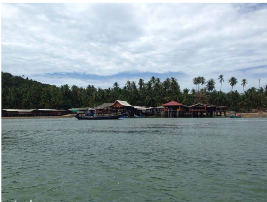
ภาพที่ 3 พื้นที่บนเกาะพิทักษ์

ชุมชนเกาะพิทักษ์มีประชากรทั้งหมด 235 คน มี 23 สายเลือด และส่วนใหญ่ประมาณ 90 เปอร์เซ็นต์ เป็นคนในพื้นที่ เกาะพิทักษ์มีเนื้อที่ทั้งหมด 712 ไร่ พื้นที่กรรมสิทธิ์ 253 ไร่ คนถือครองประมาณ 14 คน (อำพล ธานีคุรุฑ, 2557)