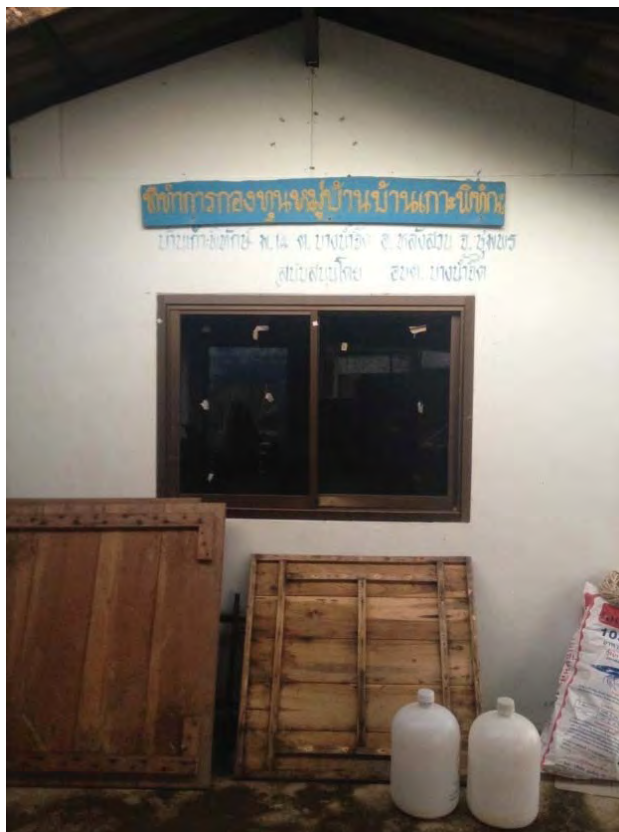
ภาพที่ 14 แสดงที่ทำการกองทุนหมู่บ้าน

เพื่อใช้ในการพัฒนาหมู่บ้าน (อรอนงค์ เย็นบางสะพาง, 2557)