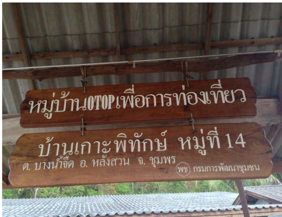
ภาพที่ 13 ป้ายหมู่บ้านเพื่อการท่องเที่ยวชุมชนบ้านเกาะพิทักษ์