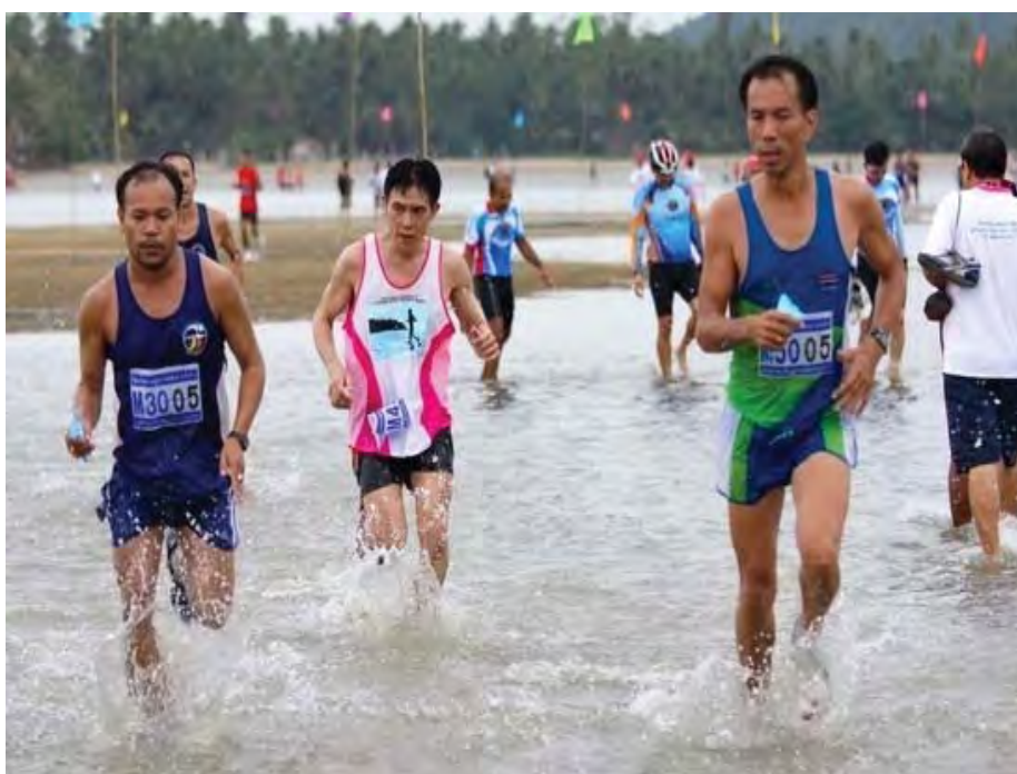
ภาพที่ 11 ประเพณีการวิ่งแหวกทะเล

ประเพณีวิ่งแหวกทะเล ซึ่งถือว่าเป็น unseen ของเกาะพิทักษ์ ประเพณีวิ่งแหวกทะเล ปีนี้จัดเป็นปีที่ 10 แล้ว และจะจัดในช่วงเดือนมิถุนายนของทุกปี วิ่งแหวกทะเลนี้เป็นสิ่งที่ผมคิดขึ้นมาเองเมื่อ 10 ปีที่แล้ว คือจุดริเริ่มอยู่ที่ว่าผมคิดว่าอะไร คือมนต์เสน่ห์ คือจุดเด่นของเกาะพิทักษ์ เมื่อคิดได้ ผมก็เลยจัดประเพณีนี้ขึ้นมา โดยที่การวิ่งแหวกทะเลนั้น จะต้องตรงกับเวลาหกโมงเช้า ซึ่งน้ำต้องแห้งและต้องให้ตรงกับวันอาทิตย์ ถ้าถามว่าทำเดือนอื่นได้หรือไม่ ก็ได้นะ แต่ที่เลือกเดือนมิถุนา เพราะว่าเป็นช่วงกลางปีพอดี (อำพล ธานีครุฑ, 2557)