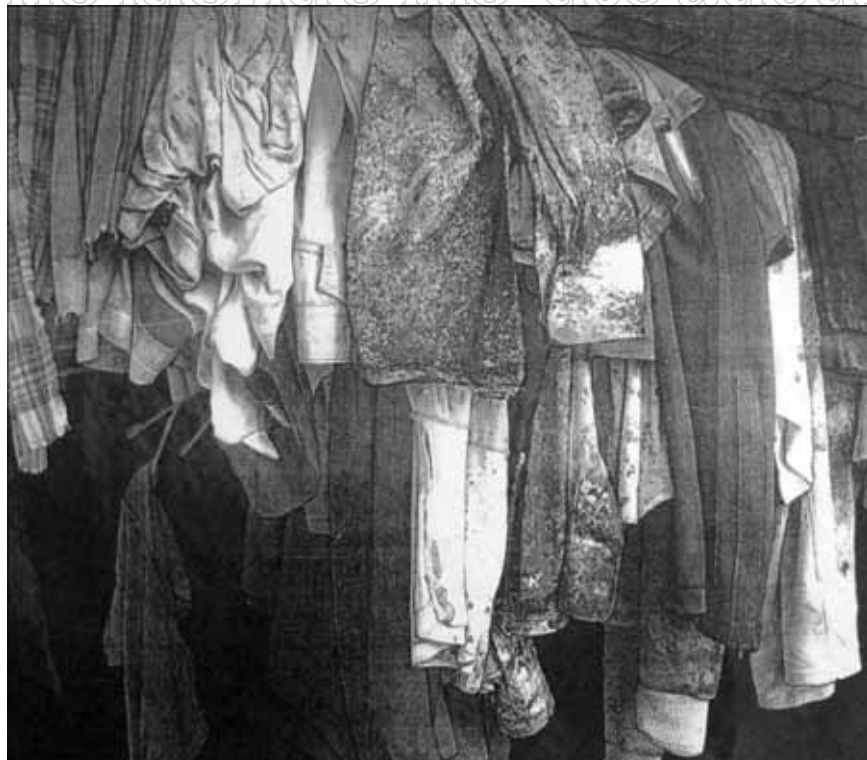
ภาพที่ 12 การกลับด้านภาพจากด้านขวาไปซ้าย ซ้ายไปขวา