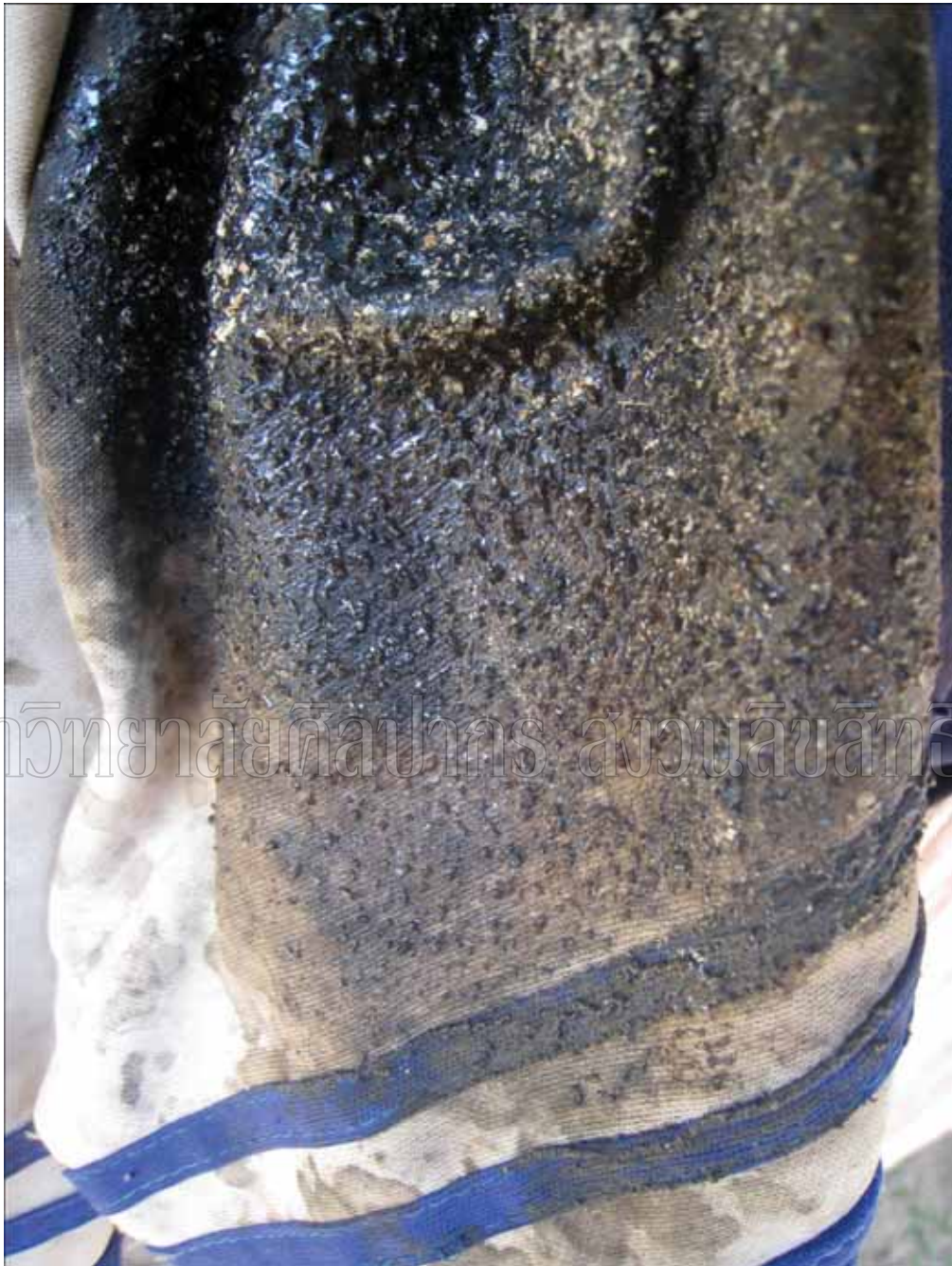
ภาพที่ 6 ร่องรอยของยางไม้ที่ปรากฏเป็นรอยเปื้อนฝังลึกอยู่