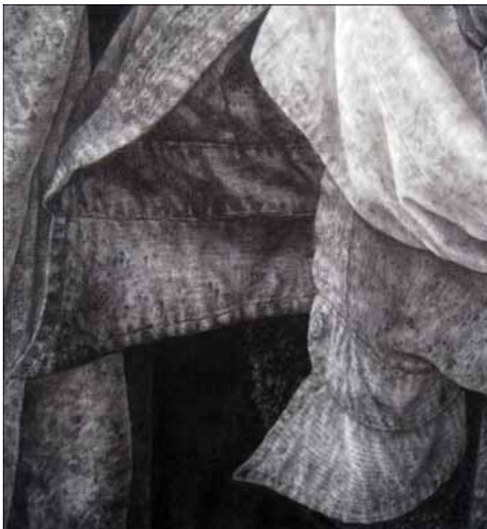
ภาพที่ 38 รายละเอียดของผลงานศิลปนิพนธ์ ชั้นที่ 2