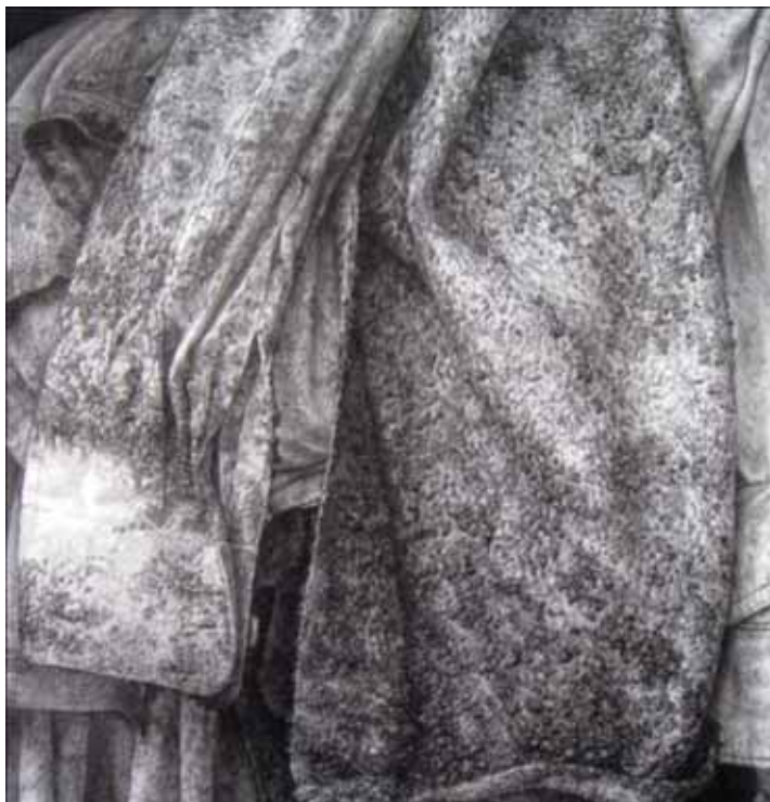
ภาพที่ 27 รายละเอียดของผลงานศิลปะนิพนธ์ ชั้นที่ 1 มหาวิทยาลัยศิลปากร สงวนลิขสิทธิ์