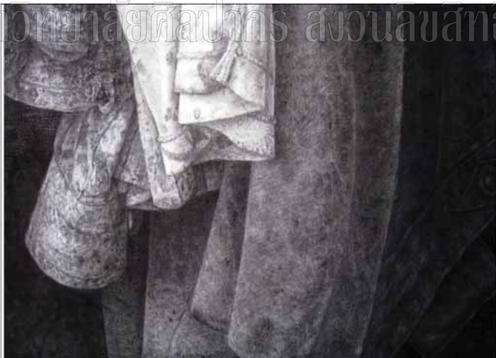
ภาพที่ 32 รายละเอียดของผลงานศิลปนิพนธ์ ชั้นที่ 1