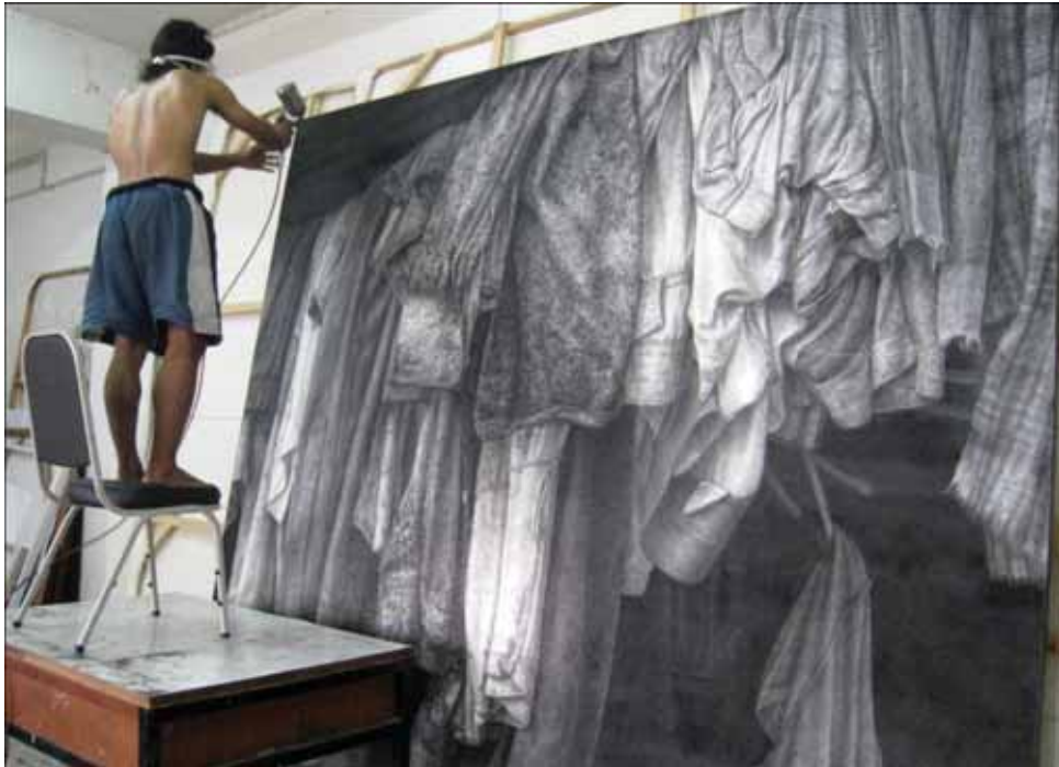
ภาพที่ 20 ขั้นตอนการเคลือบผลงาน