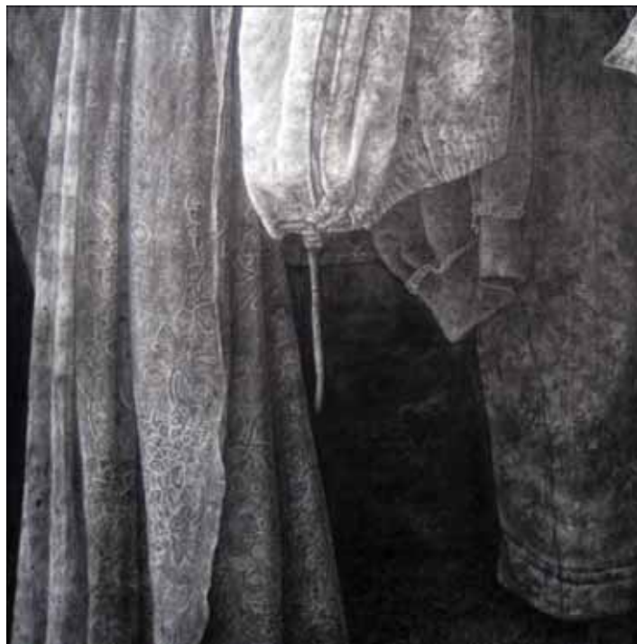
ภาพที่ 37 รายละเอียดของผลงานศิลปินพจน์ ชื่นที่ 2