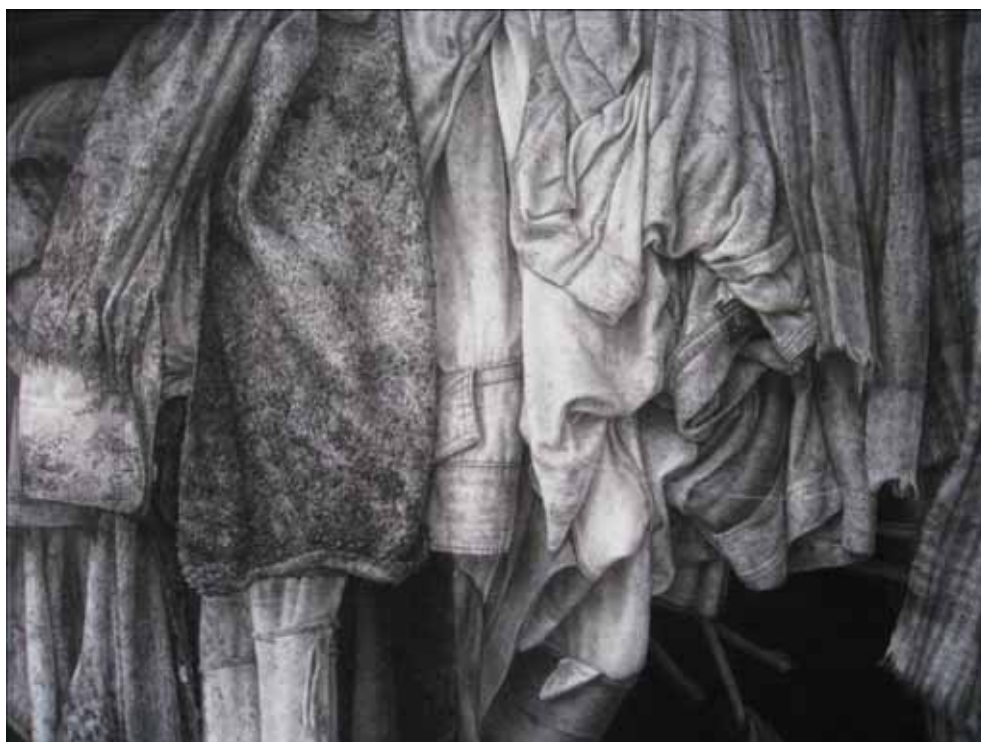
ภาพที่ 19 ขั้นตอนการแยกลักษณะของประเภทเสื้อผ้า การสร้างร่องรอยของคราบต่างๆ