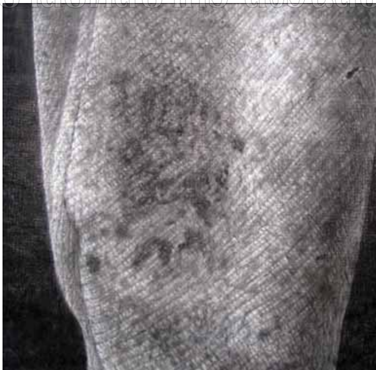
ภาพที่ 39 รายละเอียดของผลงานศิลปนิพนธ์ ชั้นที่ 2