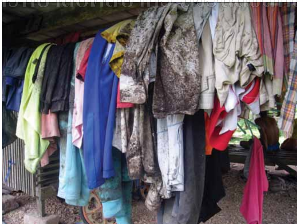
ภาพที่ 4 เสื้อผ้าเครื่องนุ่งห่มของชาวสวนยาง