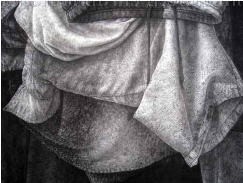
ภาพที่ 35 รายละเอียดของผลงานศิลปนิพนธ์ ชั้นที่ 2