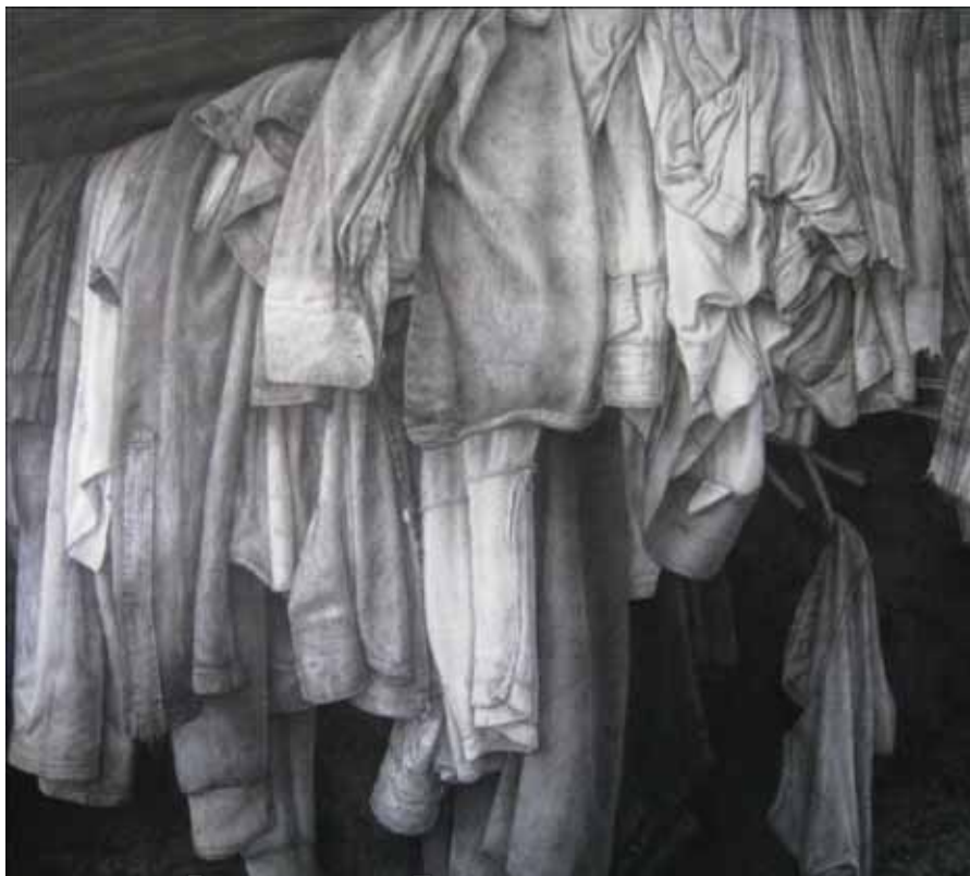
ภาพที่ 18 ขั้นตอนการลงน้ำหนักแสงเงา แยกค่าน้ำหนักสีของเสื้อผ้าเป็นน้ำหนักขาวดำ