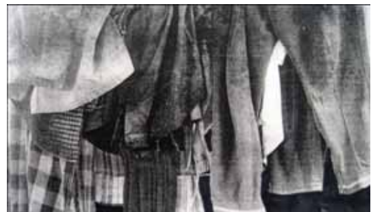
ภาพที่ 9 ภาพร่างผลงาน