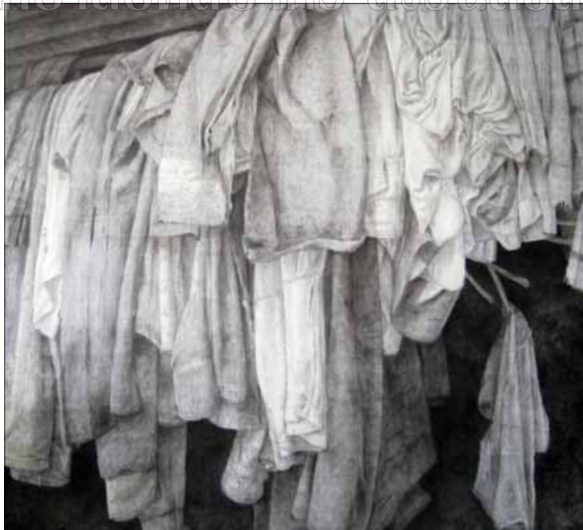
ภาพที่ 17 ขั้นตอนการลงน้ำหนักผลงาน