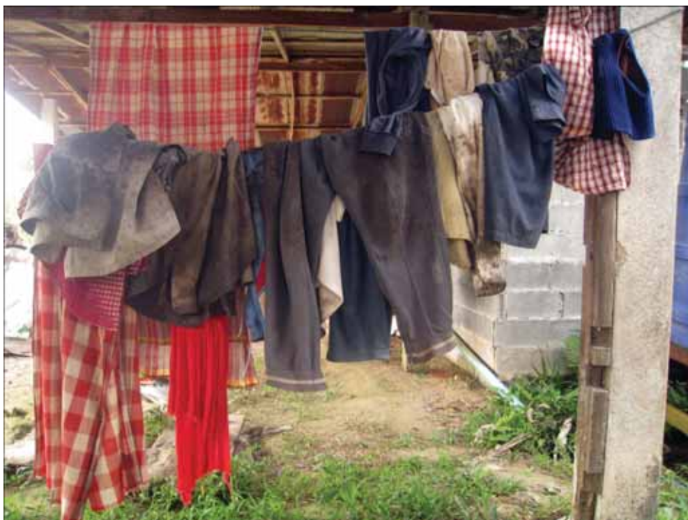
ภาพที่ 3 เสื้อผ้าเครื่องนุ่งห่มของชาวสวนยาง