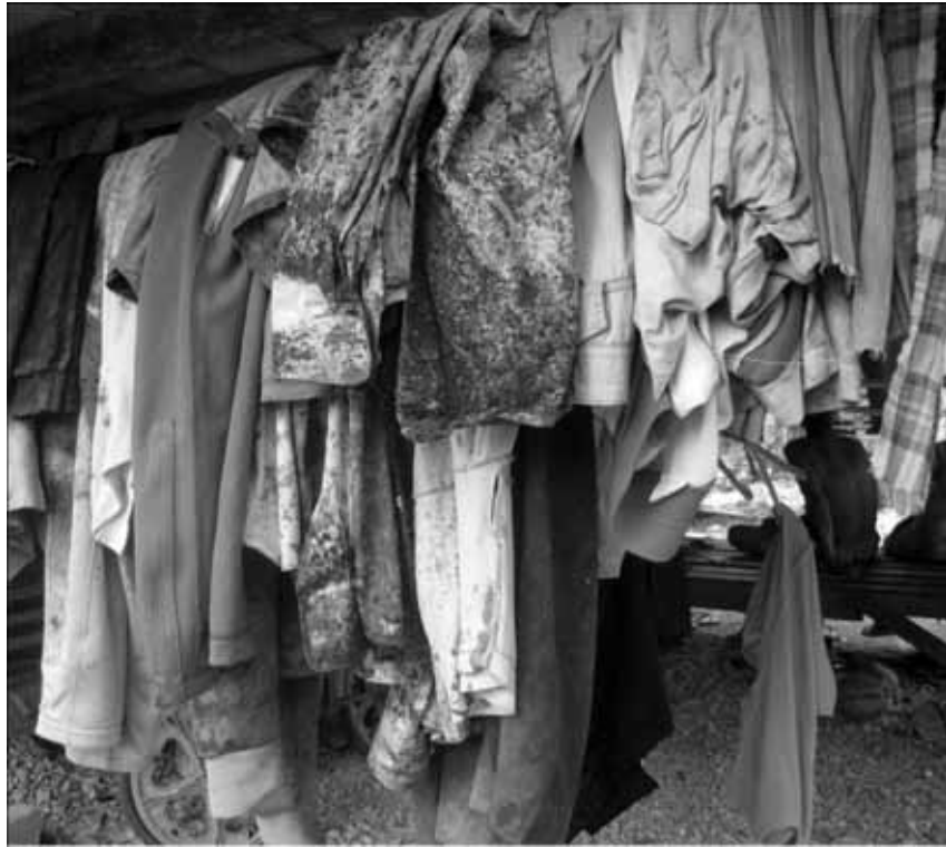
ภาพที่ 11 การกลับค่าน้ำหนักสีเป็นน้ำหนักขาวดำ