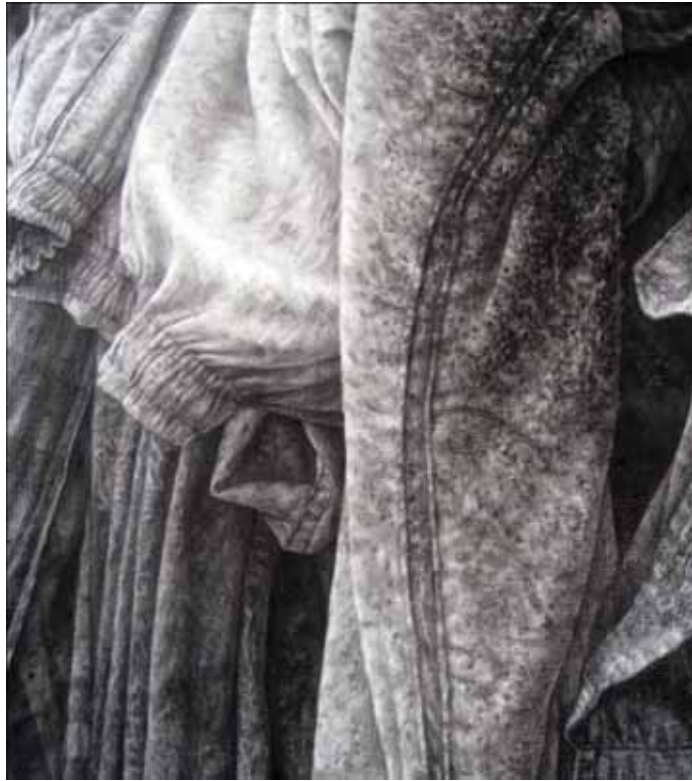
ภาพที่ 36 รายละเอียดของผลงานศิลปินพจน์ ชื่นที่ 2