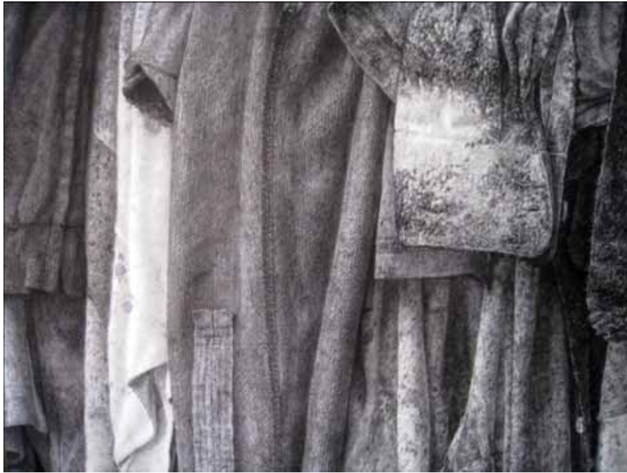
ภาพที่ 31 รายละเอียดของผลงานศิลปนิพนธ์ ชั้นที่ 1