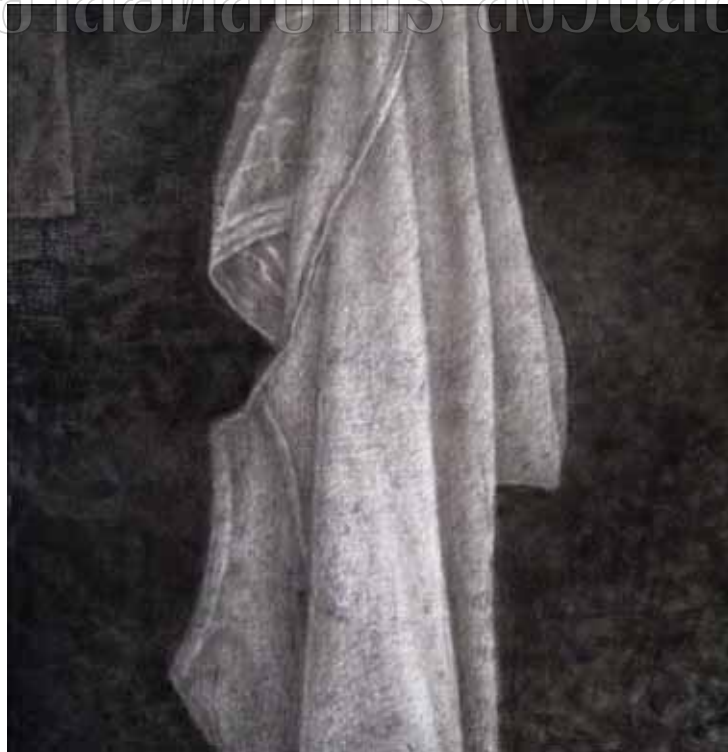
ภาพที่ 30 รายละเอียดของผลงานศิลปนิพนธ์ ชั้นที่ 1