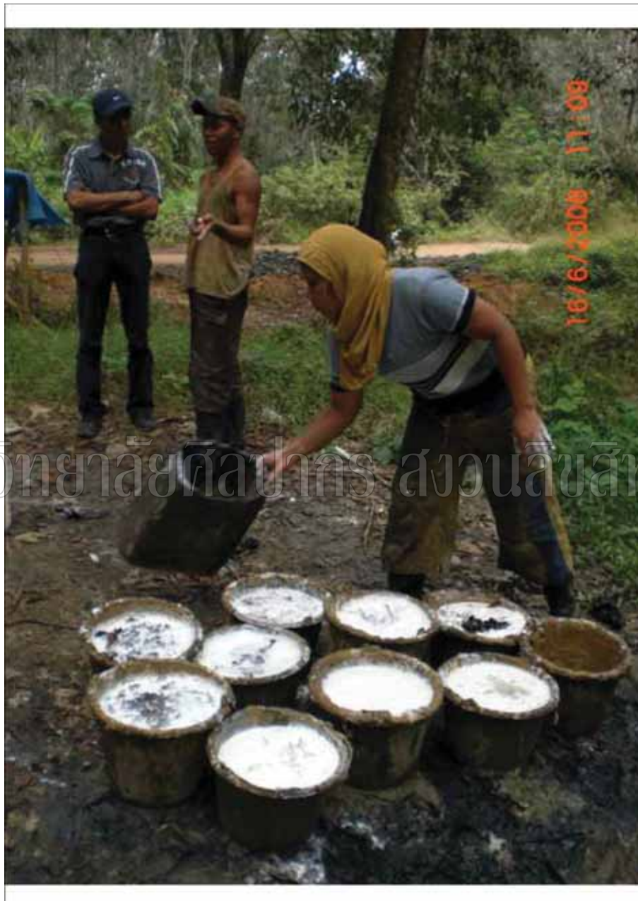
ภาพที่ 1 ชาวสวนยาง