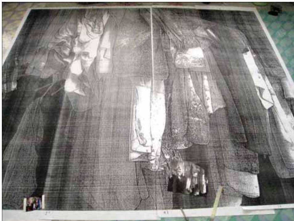
ภาพที่ 14 ภาพถ่ายเอกสารขยายสัดส่วนเท่าขนาดพื้นเฟรมผ้าใบ