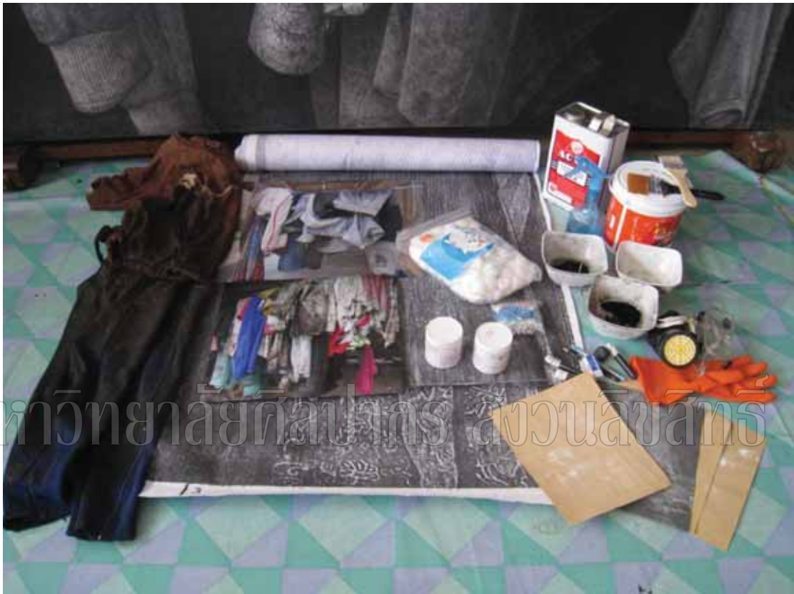
ภาพที่ 8 อุปกรณ์ที่ใช้ในการสร้างสรรค์