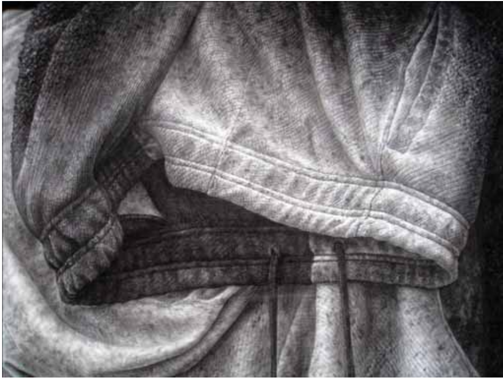
ภาพที่ 34 รายละเอียดของผลงานศิลปนิพนธ์ ชั้นที่ 2 มหาวิทยาลัยศิลปากร สงวนลิขสิทธิ์