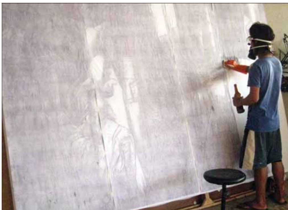
ภาพที่ 15 ขั้นตอนการถ่ายเท้ายที่ฝังคาร์บอนจากกระดาษถ่ายเอกสารลงบนพื้นเฟรมผ้าใบ