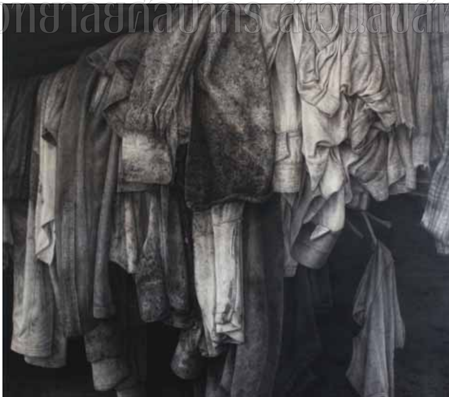
ภาพที่ 21 ผลงานสำเร็จ