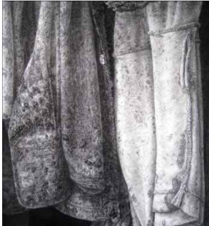
ภาพที่ 29 รายละเอียดของผลงานศิลปนิพนธ์ ชั้นที่ 1 มหาวิทยาลัยศิลปากร สงวนลิขสิทธิ์