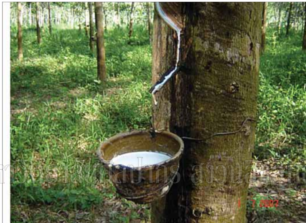
ภาพที่ 5 ยางไม้(น้ำยางพารา)