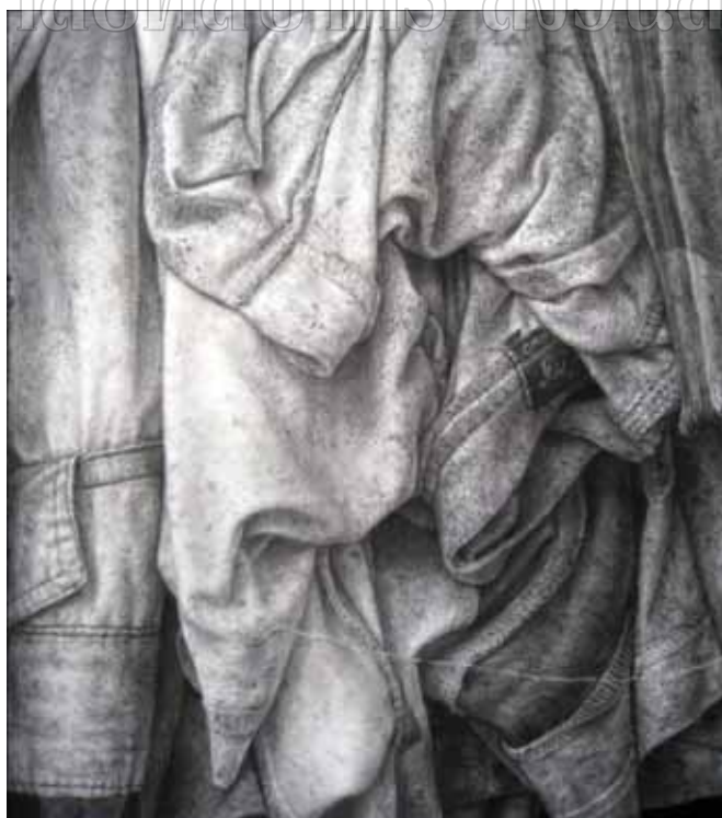
ภาพที่ 28 รายละเอียดของผลงานศิลปะนิพนธ์ ชั้นที่ 1