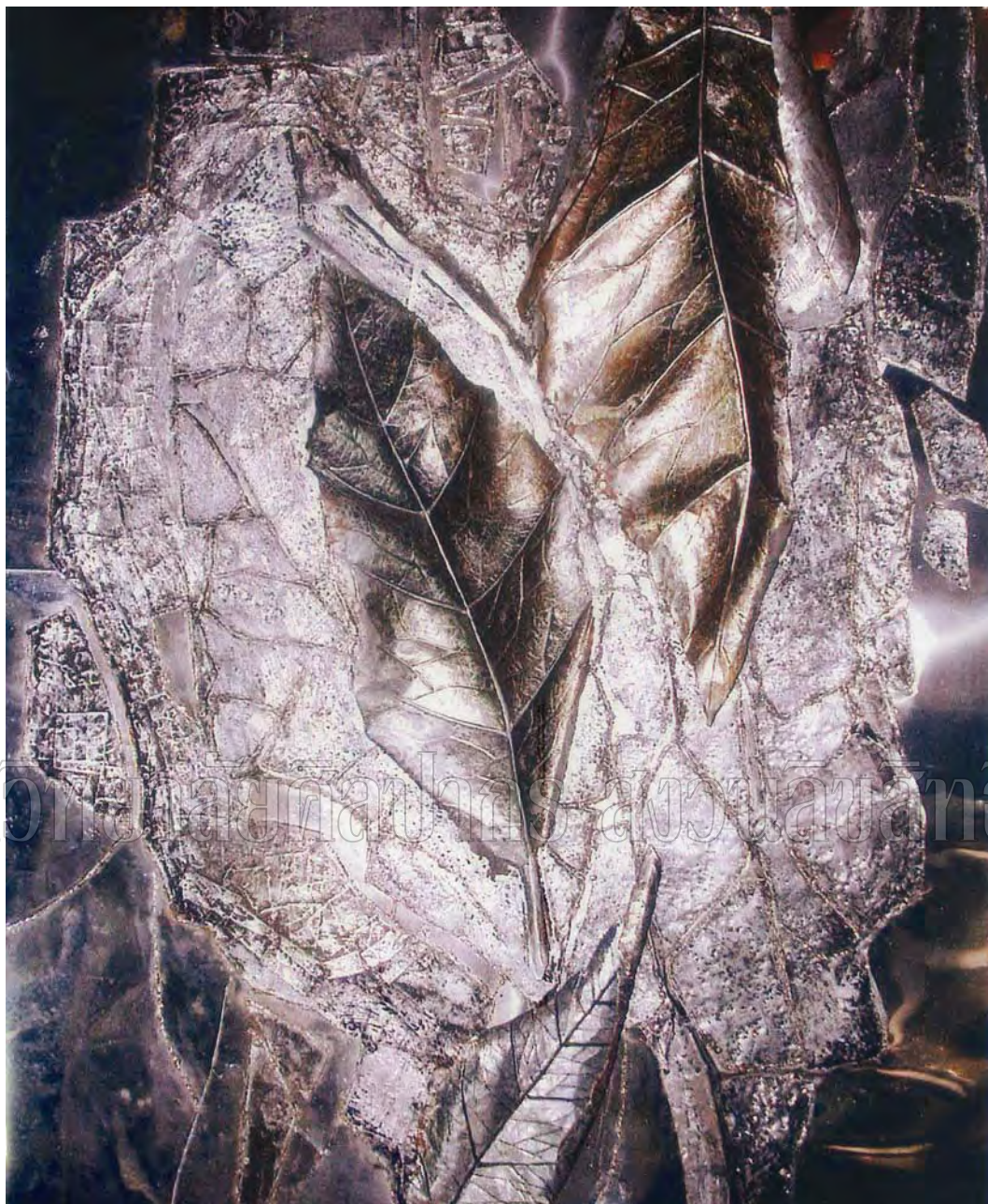
ภาพที่ 8 ผลงานช่วงก่อนวิธานิพนธ์ ชั้นที่ 4