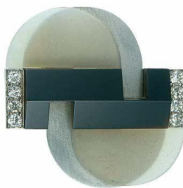
ภาพที่ 5 ผลงานของ เรย์มอนด์ ตองปลิเย, 1937