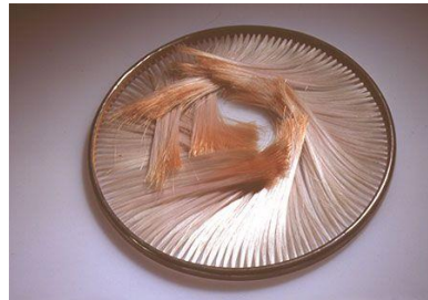
ภาพที่ 8 ผลงานของ Caroline Broadhead(1981)

ศิลปินที่ยังคงใช้องค์ประกอบศิลปะอย่างมากในการถ่ายทอดชิ้นงานก็จะหันมาสนใจในการเปลี่ยนวัสดุเพื่อการเปลี่ยนแปลงแนวคิดที่ทำทายรูปแบบเดิมๆ ทำให้รูปแบบของเครื่องประดับยุคสมัยใหม่ตอนปลาย มีการใช้วัสดุที่หลากหลาย เช่นกระดาษ เส้นใย และสิ่งทอ ซึ่งเป็นวัสดุที่ไม่มีค่า ไม่คงทน แต่สามารถสร้างชิ้นงานที่มีรูปแบบนุ่มนวลกว่าโลหะ เพื่อสะท้อนและเปิดมุมมองให้เห็นว่า วัสดุไม่ใช่สิ่งสำคัญอีกต่อไป เช่นผลงานของ Caroline Broadhead ที่ใช้เส้นไพล่อนยึดหยุ่นได้มาสร้างเป็นงานเครื่องประดับ