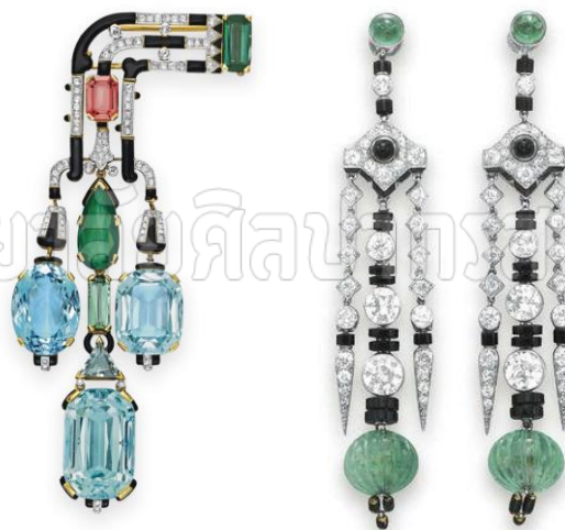
ภาพที่ 3 เครื่องประดับของคาร์ทีเยร์ (Cartier 1927-1930)

กลุ่มดาตาที่พูดถึงการต่อต้านสงครามโลกครั้งที่ 1 การตัดทอนรูปทรงสู่ความเรียบง่ายเป็นสิ่งที่สะท้อนให้เห็นถึงบรรยากาศของสังคมมนุษย์ในยุคนั้น ส่งผลต่องานเครื่องประดับแบบอาร์ตเดคโคที่มีการจัดวางของเส้นที่คมชัด แม่นยำ มีรูปทรงที่เป็นเรขาคณิต งานเครื่องประดับแบบอาร์ตเดคโคมีลักษณะเด่นชัดในช่วงระหว่างสงครามโลกครั้งที่ 1 ถึงครั้งที่ 2 เมื่อหลังสงครามโลกครั้งที่ 1 ผู้คนได้กลับมาใช้ชีวิตหรูหราอีกครั้งแต่บรรยากาศของสังคมเปลี่ยนไป มนุษย์จึงต้องการจัดระบบระเบียบให้กับชีวิต เส้นสาย ทิศนาคที่เกิดขึ้นกับงานเครื่องประดับ ในยุคนี้จึงไม่พูดถึงชีวิตที่เป็นธรรมชาติสะท้อนให้เห็นว่ามนุษย์ต้องการความก้าวหน้า งานเครื่องประดับเริ่มมีความเป็น unisex ตามกระแสแฟชั่นที่เปลี่ยนไปตามยุคสมัย โดยเฉพาะการแต่งกายของผู้หญิงที่หันมาสวมกางเกง หรือชุดที่หลวมและสั้นขึ้น แสดงถึงความเท่าเทียมด้านภาพลักษณ์ กรุงปารีสเป็นอาณาจักรที่อยู่แถวหน้าของงานในยุคนี้ เครื่องประดับแบบอาร์ตเดคโคมีรูปทรงเรขาคณิตฝังอัญมณีราคาแพงร่วมกับอัญมณีราคากลางๆเช่นเทอร์ควอยซ์ และปะการัง แต่สำหรับกลุ่มคนที่มีฐานะนั้นอัญมณีราคาแพงกลับมามีบทบาทอีกครั้ง งานที่ดีที่สุดในยุคนี้คืองานหลายชิ้นของ คาร์ทีเยร์ (Cartier) ที่มีการวางอัญมณีแบบมีแบบแผน เกิดเป็นเส้นสายที่แม่นยำ