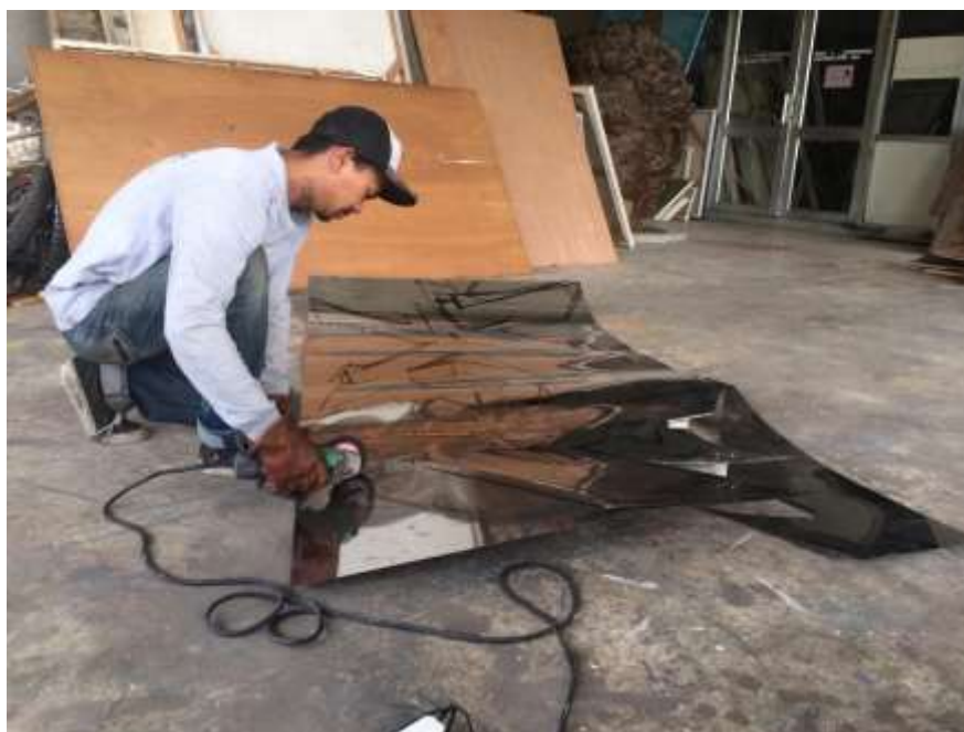
ภาพที่ 11 ตัดเหล็กตามเส้นร่าง