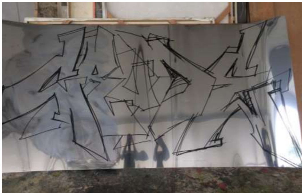
ภาพที่ 10 ลงมือเขียนเส้นร่าง