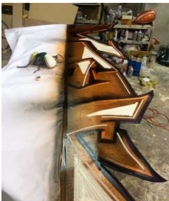
ภาพที่ 15 การทำสีแบบคัสต้อม