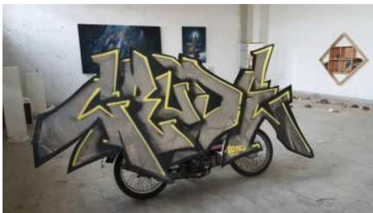
ภาพที่ 17 ภาพทดลองขับเคลื่อน ภาพที่ 1