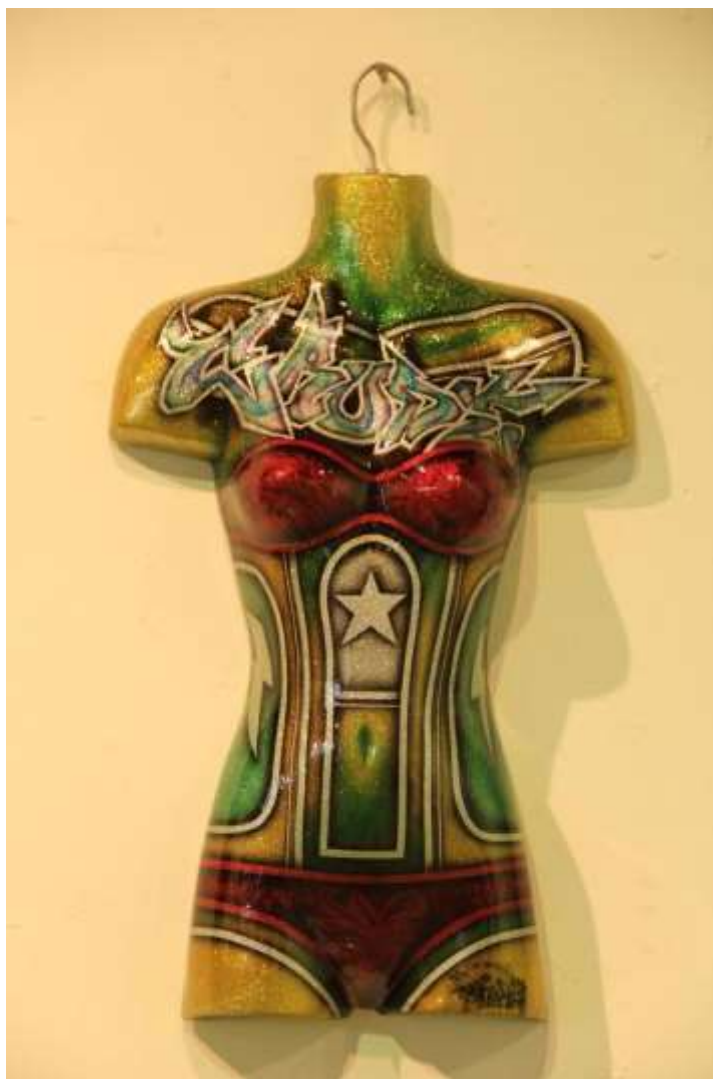
ภาพที่ 22 ภาพผลงานช่วงโครงการศิลปนิพนธ์ระยะต้น ชั้นที่ 1