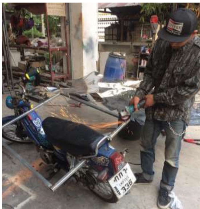
ภาพที่ 12 การทำโครงสร้างเพื่อการติดตั้งชิ้นงาน