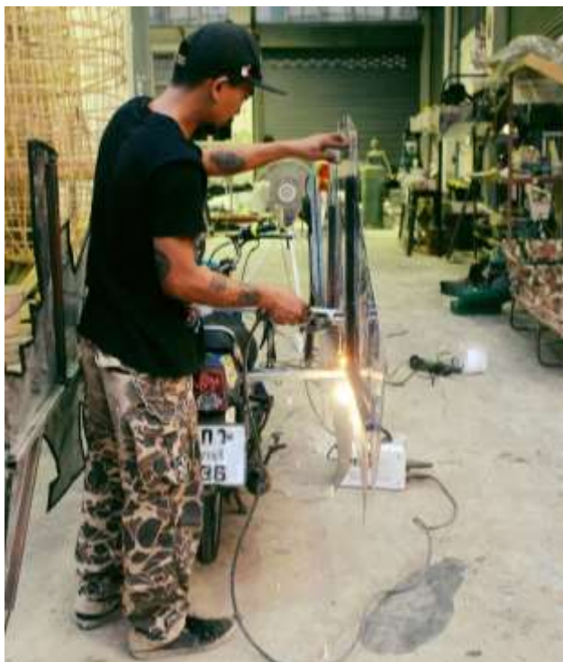
ภาพที่ 16 การตรวจสอบและติดตั้งผลงาน