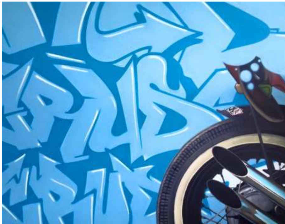
ภาพที่ 20 ภาพผลงานช่วงก่อนโครงการศิลปนิพนธ์ ชั้นที่ 1

ในการสร้างสรรค์ผลงานช่วงก่อนโครงการศิลปนิพนธ์ ผลงานของข้าพเจ้าอาจเห็นถึงความมุ่งมั่นแต่ในเรื่องของจักรยานยนต์เป็นสิ่งสำคัญ แต่ทว่าในความเป็นจริงนั้นข้าพเจ้าเพียงแต่ยังไม่มีความปรากฏชัดเจนนักในด้านของเนื้อหาที่ข้าพเจ้าต้องการแสดงออก จึงทำให้ผลงานในระยะแรกนี้ลู่ลวงเพียงแต่ในด้านรูปแบบ มีรูปแบบที่สวยงามน่าสนใจ เพียงยังขาดเนื้อหาที่จะทำให้ตัวผลงานโดดเด่นและแสดงออกถึงพลังความเป็นอิสระ ที่มีอยู่ในสิ่งทั้งสอง กราฟฟิตี้และจักรยานยนต์คู่สุดอม ที่ข้าพเจ้าต้องการนำเสนอ