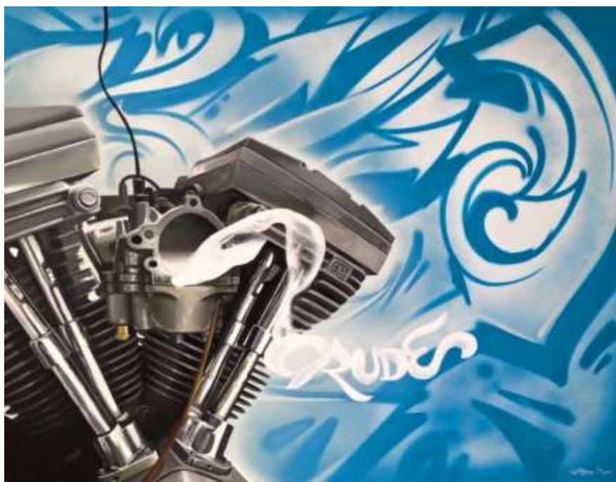
ภาพที่ 21 ภาพผลงานช่วงก่อนโครงการศิลปนิพนธ์ ชั้นที่ 2