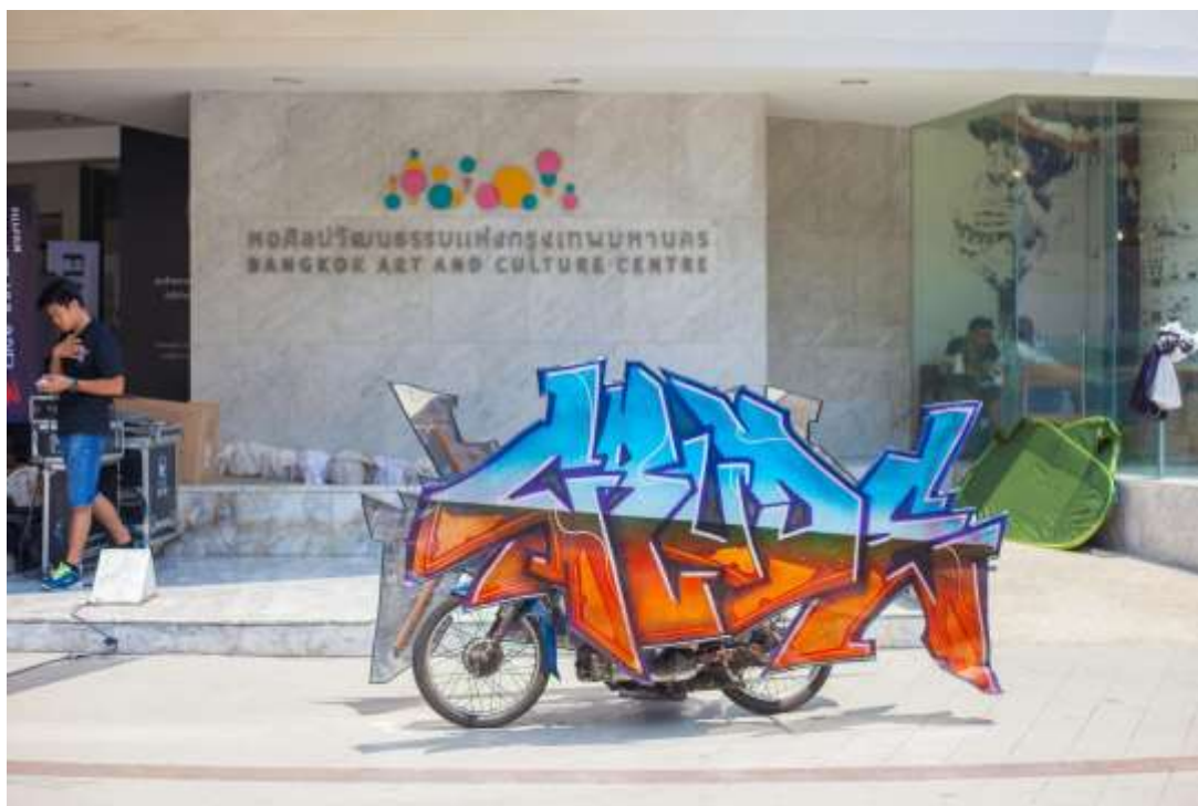
ภาพที่ 27 ภาพผลงานศิลปะนิพนธ์ ภาพที่ 3