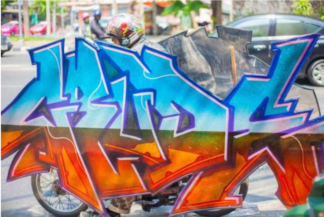
ภาพที่ 25 ภาพผลงานศิลปะนิพนธ์ ภาพที่ 1