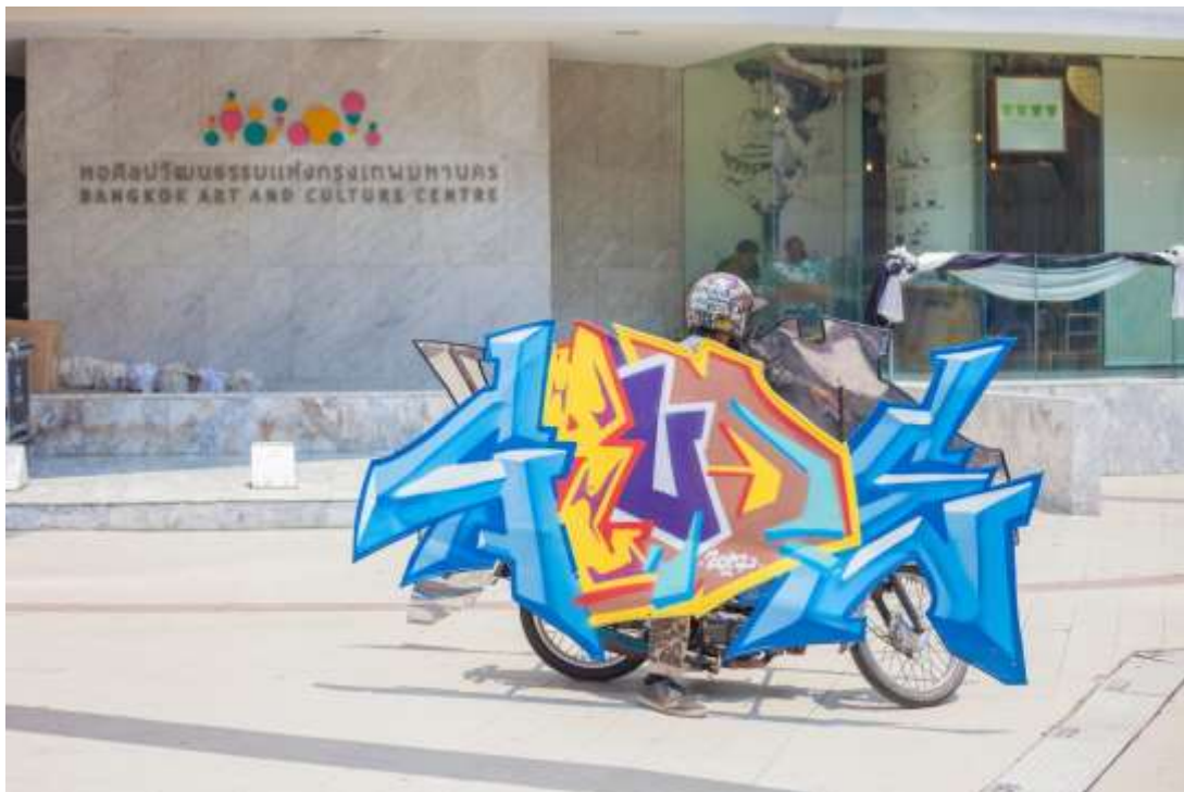
ภาพที่ 26 ภาพผลงานศิลปะนิพนธ์ ภาพที่ 2