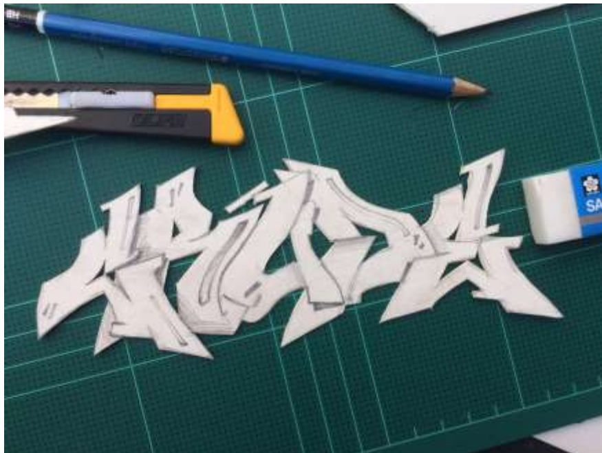
ภาพที่ 8 ร้างแบบลงบนกระดาษชานอ้อย

1.2 ร้างแบบจำลอง 3 มิติอย่างง่าย จากการตัดกระดาษชานอ้อยและประกอบกับการจำลองตัวรถจักรยานยนต์พร้อมติดตั้ง