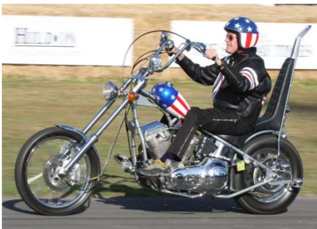
ภาพที่ 5 American Chopper

ชอปเปอร์ (Chopper) เกิดขึ้นในสหรัฐอเมริกา ช่วงกลางทศวรรษที่ 1960 เป็นสไตล์ของรถคัสต้อมประเภทหนึ่งที่มีความหมายกว้าง ๆ และแตกแขนงไปหลากหลายสไตล์ ชอปเปอร์ เป็นคำใช้เรียกรถจักรยานยนต์ที่ผู้ใช้จัดการกับตัวรถของตนเองให้เหมาะกับการใช้งานหรือความพอใจของตนเอง หมายถึง การถอดชิ้นส่วนที่ไม่จำเป็นต่อการใช้งานออก หรือการนำเอาอุปกรณ์ต่าง ๆ ที่มีความยุ่งยากในการบำรุงรักษาออก ปรับเปลี่ยนให้มีความยาวขึ้นและสร้างความท้าทายให้กับการขับขี่ด้วยการนำระบบกันสะเทือนล้อหลังออกหรือที่เรียกกันว่าฮาร์ดเทล (Hardtail) เป็นต้น