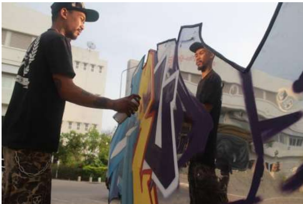
ภาพที่ 14 พ่นสีสเปรย์ลงบนแผ่นเหล็ก