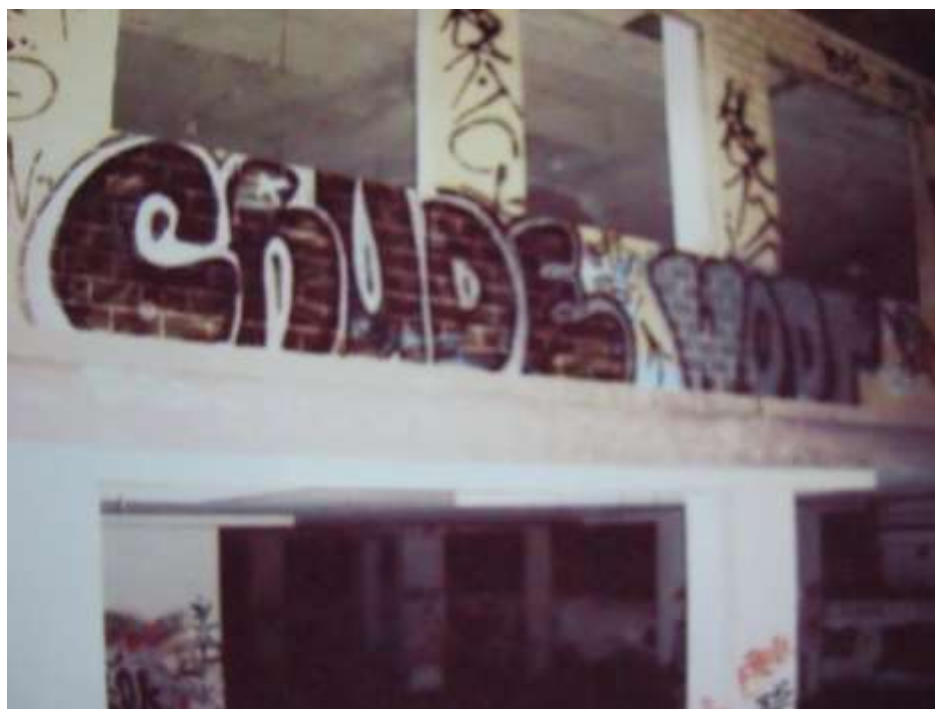
ภาพที่ 4 ผลงานของข้าพเจ้าในยุคเริ่มต้น ถ่ายเมื่อปี พ.ศ.2552 (2009)

กว่า 60 ร้าน โดยไม่มีการคัดเลือกผู้เข้าแข่งขัน มีกลุ่ม Graffiti Writer ผู้สนใจจำนวนมากไปร่วมงาน หลังจากนั้นมาการพ่นกราฟฟิตี้ในประเทศไทยจึงแพร่หลายสู่กลุ่มวัยรุ่นอย่างต่อเนื่องอีกทั้ง บางส่วนก็มีการเล่น Skate Board ซึ่งสิ่งสิ่งพิมพ์ที่อยู่ควบคู่กับการเล่น Skate Board ก็มีแนวงาน กราฟฟิตี้สอดแทรกอยู่เช่นกันจุดนี้เองก็เป็นอีกแรงบัลดาลใจหนึ่งที่มีความสำคัญและเป็นจุดเริ่มต้น ของบรรดา Graffiti Writer หลาย ๆ คน รวมถึงตัวข้าพเจ้า