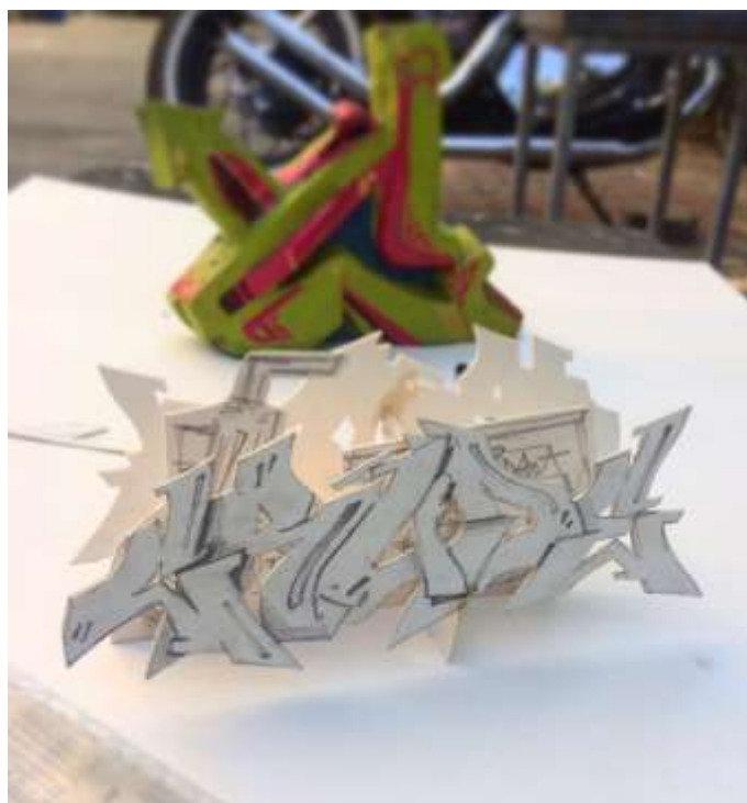
ภาพที่ 9 จำลองการติดตั้ง