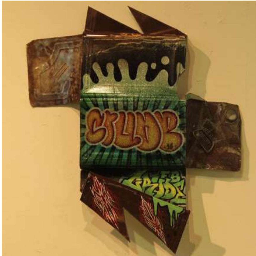
ภาพที่ 23 ภาพผลงานช่วงโครงการศิลปนิพนธ์ระยะต้น ชั้นที่ 2