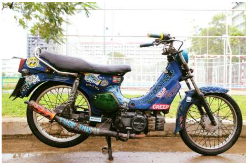
ภาพที่ 7 ภาพความพร้อมของจักรยานยนต์