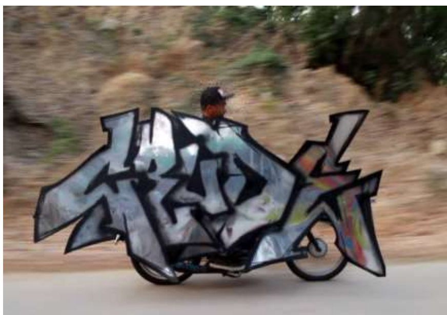
ภาพที่ 13 การทดลองขับขี่เบื้องต้น