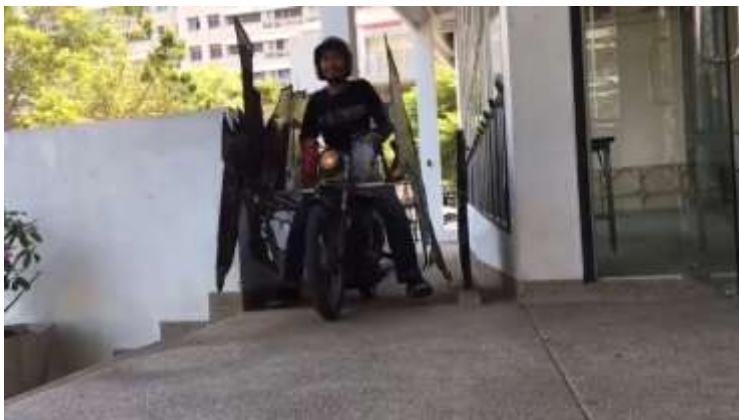
ภาพที่ 18 ภาพทดลองขับเคลื่อน ภาพที่ 2