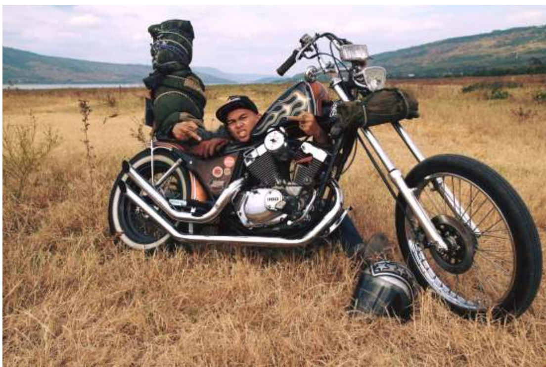
ภาพที่ 6 ภาพจักรยานยนต์คัสต้อมของข้าพเจ้า

การแข่งขัน จึงเป็นที่มาให้ข้าพเจ้าตกลงที่จะเลือกใช้จักรยานยนต์ยี่ห้อประเภทนี้ ภายหลังจากการได้สัมผัสและใช้งานในระยะแรกยิ่งทำให้ข้าพเจ้ารู้สึกถึงพลังความรักความชอบในสไต์ลี้้นี้มากขึ้น เนื่องจากมันมีความแตกต่างออกไปจากรถทั่ว ๆ ไปบนท้องถนน และเรียกความสนใจจากผู้พบเห็นเป็นอย่างดี ด้วยเหตุผลดังกล่าว ส่งผลโดยตรงให้ข้าพเจ้าเล็งเห็นแนวทางในการสร้างผลงานกราฟฟิที่ีร่วมกับตัวจักรยานยนต์ เพื่อหวังสร้างเป็นผลงานศิลปกรรมในรูปแบบที่แตกต่าง