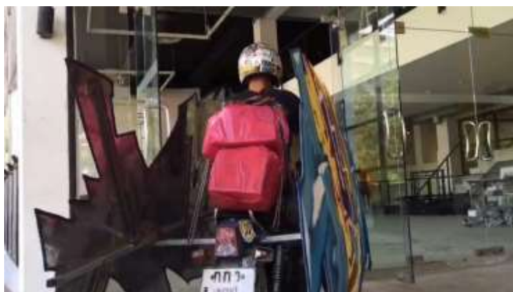
ภาพที่ 19 ภาพทดลองขับเคลื่อน ภาพที่ 3