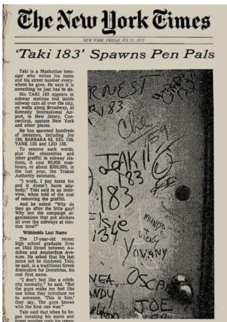
ภาพที่ 1 "Taki 183" Spawns Pen Pals, The New York Time 1971

ความเติบโตทางเศรษฐกิจอยู่ในอันดับต้นของโลก จนกระทั่งการแสดงออกต่าง ๆ เหล่านี้ได้แพร่กระจายสู่กลุ่มวัยรุ่นทั่วไป รวมถึงวัยรุ่นผิวขาวก็ตามและมีพัฒนาการด้านรูปแบบอย่างรวดเร็ว และต่อเนื่องจนกระทั่งมาเป็นผลงานที่คู่มีความสลับซับซ้อนและใช้ทักษะฝีมือทางศิลปะอย่างมากในปัจจุบัน