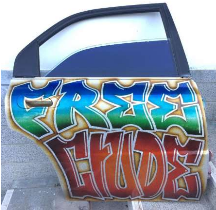
ภาพที่ 24 ภาพผลงานช่วงโครงการศิลปนิพนธ์ระยะต้น ชั้นที่ 3