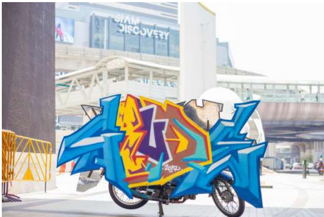
ภาพที่ 28 ภาพผลงานศิลปะนิพนธ์ ภาพที่ 4