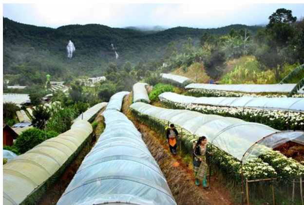
ภาพที่ 5 แปลงทดลองปลูกไม้ดอกทดแทนฝิ่น, สถานีเกษตรหลวงลอยอินทนนท์

หากกล่าวถึงการเป็นแบบอย่างการดำเนินชีวิตที่ประเสริฐนั้น พระบาทสมเด็จพระปรมินทรมหาภูมิพลอดุลยเดช ทรงเป็นแบบอย่างที่ดีงามในเรื่องของการดำรงชีวิตอยู่ด้วยธรรมะที่ทรงเป็นแบบอย่างแก่พสกนิกร คือ การใช้ชีวิตด้วยความพอเพียง ประหยัด และใช้ทรัพยากรธรรมชาติให้เกิดประโยชน์สูงสุด ดังพระราชดำรัส เมื่อวันที่ 31 ธันวาคม พ.ศ. 2502