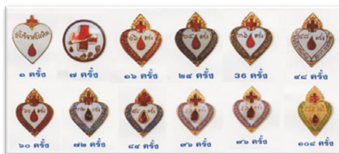
ภาพที่ 7 เข็มกลัดที่ระลึกสภากาชาด