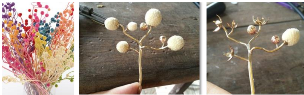
ภาพที่ 8 (ซ้าย) ดอกสาकुทียุคจากโครงการหลวง (กลางและขวา) วิธีประกอบชิ้นงานเครื่องประดับ

ชิ้นถูกแทนค่าด้วยรูปร่างของเหรียญที่มีขนาดและจำนวนที่แตกต่างกัน เพื่อสร้างสรรค์ให้เหรียญจำนวนต่าง ๆ ประทับกันได้ด้วยกลไกที่ลอกเลียนแบบมาจากกลไกของกระเป๋าสตางค์ทั่วไป จึงทำให้เหรียญทั้งสองเปิดปิดได้นอกเหนือจากนั้น เหรียญจะถูกออกแบบให้มีประโยชน์ใช้สอยเป็นเข็มกลัด โดยสามารถนำไปกลัด ณ ที่บริเวณหน้าอกด้านซ้ายของผู้สวมใส่อันเป็นตำแหน่งเดียวกับอวัยวะส่วนของหัวใจมนุษย์ ด้วยหวังจะให้เครื่องประดับเป็นเสมือนวัตถุเพื่อการระลึกถึงคำสอนของพระองค์ที่จะ “สถิตในดวงใจ” トラบนานเท่านั้น