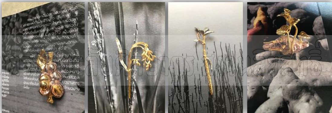
ภาพที่ 3 เครื่องประดับพืชพันธุ์แห่งชีวิต