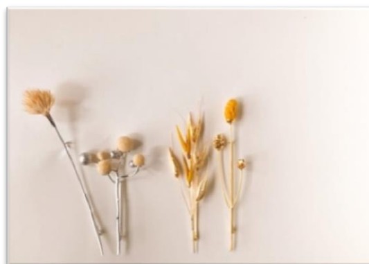
ภาพที่ 1 เครื่องประดับจากผลิตภัณฑ์บุหงาโครงการหลวง

2. ด้านการสร้างสรรค์: ต้นแบบเครื่องประดับจำนวน 4 ชุด: องค์ความรู้ด้านการออกแบบสร้างสรรค์ “เครื่องประดับแห่งการรำลึก” ที่ส่งเสริมการสร้างกระบวนการทัศนียภาพใหม่ การดำเนินงานด้วยการอาศัยทุนทางสังคม และวัฒนธรรมอันเป็นประโยชน์ต่อการสืบสานพระราชปณิธานต่อไป