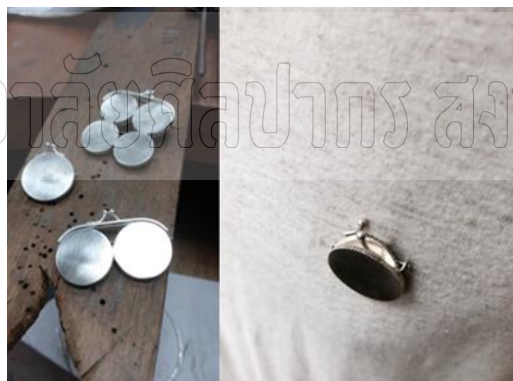
ภาพที่ 9 ลักษณะของเข็มกลัดเหรียญที่เปิดปิดได้

ในการที่พระบาทสมเด็จพระปรมินทรมหาภูมิพลอดุลยเดช เสด็จสู่สวรรคาลัย ในวันที่ 14 ตุลาคม 2559 คติธรรมที่ควรแก่การพิจารณาถึงเมื่อครั้งที่พระพุทธเจ้าตรัสต่อพระอานนท์ ดังที่เห็นปรากฏในมหาปรินิพพานสูตร พระสุตตันตปิฎก เล่มที่ 2 ทีฆนิกาย มหาวรรค