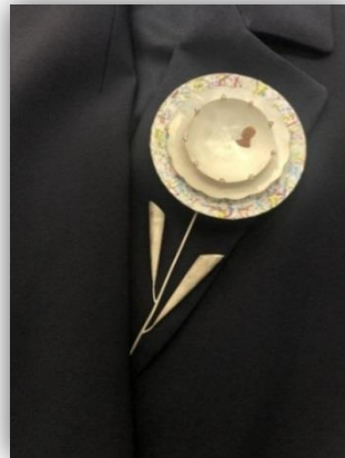
ภาพที่ 2 เครื่องประดับดอกไม้พระราช